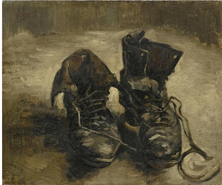
Resim 1. Vincent Van Gogh “Ayakkabılar”, 38.1 x 45.3 cm., Tuval Üzerine Yağlı Boya, 1886.