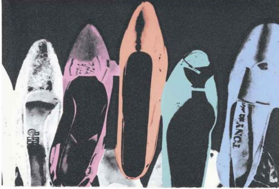
Resim 3. Andy Warhol, "Diamond Dust Shoe Serisi", 101 x 152 cm, Serigrafı Baskı, 1980.

Bununla birlikte Warhol'un ayakkabı serisi bir "Queer" anlatı örneği olarak görülebilir. Birinci kuşak feminizm ile birlikte cinsiyet rolleri, cinsel özgürlük ve kadın haklarını içeren birçok tartışma gündeme gelmiş ve bu tartışmalar LGBTİ+ bireylerin de haklarını aramaya başlamasına dayanışma bağlamında referans olmuştur. Sanatçının ikonikleştirdiği ayakkabıların Drag Queen'lerin sıklıkla kullandığı, abartılı yüksek topuklar, parlak renklerle 'queer' sahne kültürüne göndermelerde barındırdığı düşünülebilir.