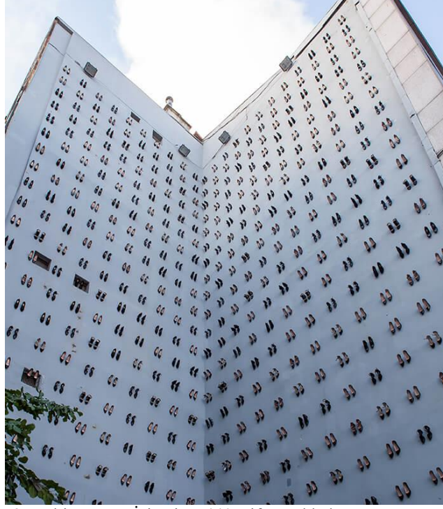
Resim 9. Vahit Tuna, “İsimsiz”, 440 Çift Ayakkabı, Hazır Nesne, 2019.

Sanatçı Vahit Tuna 2019 yılında gerçekleştirdiği “İsimsiz” adlı eseriyle, 2018 yılında öldürülmüş 440 kadını anmak adına 440 çift kadın ayakkabısını Yanköşe platformunda sergilemiştir. “Ölen kişilerin ayakkabılarının evlerinin kapısının önüne bırakılması geleneğine de işaret eden bu çalışma, kadına yönelik şiddetin hafızasını tutarak sokağa taşıyor; kamusal bir tartışma ve bilinçlenme için bir aracı olma görevini üstleniyor” (Yanköşe. 2019:1). Kadına yönelik şiddetin arttığı bir süreç olarak günümüz sorununa değinen Vahit Tuna’nın eseri; şiddet vakalarının artmasındaki neden olan günlük yaşantıda eril söylemin durmasına yönelik bir çağrı olarak da algılanabilir.