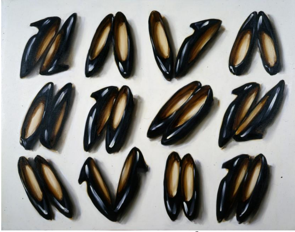
Resim 4. Lisa Milroy, “Shoes”, 175 x 226 cm. Tuval Üzerine Yağlı Boya, 1985.