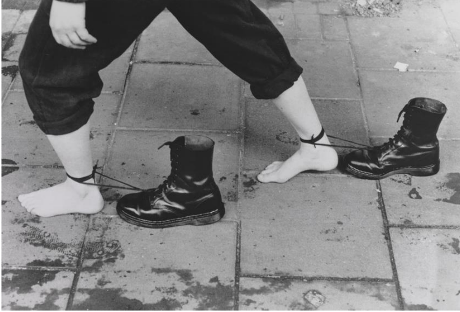
Resim 5. Mona Hatoum, “Still Performance”, Performansa Ait Fotoğraf, 1985.

Nesne bazlı sanat, performans, video sanatında etkileşimli bir şekilde görüldüğü gibi, günümüz sanatında da etkisini sürdürmektedir. Bu açıklamalar bağlamında Mona Hatoum'un “Performance Still” adlı çalışması önemlidir. Mona Hatoum'un 1985 yılında Londra, Brixton sokaklarında gerçekleştirdiği performansı gündelik yaşam pratikleri ve iktidar çatışması üzerinedir. 1980'li yıllar Brixton'da sıklıkla etnik kökenli çatışmalar ve polis müdahaleleri gerçeklemiştir. Kendisi de bir “öteki” olan sanatçı, Dr. Marten marka ayakkabıların bağcıklarını ayağına bağlayarak yaklaşık bir saat yürümüştür. Dr. Marten ayakkabı markası o dönemde polisin kullandığı ayakkabılardandır. Bu bağlamda sanatçı, iktidarın oluşturduğu baskıyı vurgulamakta ve eleştirmektedir. “Sanatçı sokakta yürüme edimini, gündelik yaşamın sıradan bir eylemini, gündelik yaşamı modelleyen bir iktidarın tahakkümüne direnişe dönüştürür. Foucault'un “İktidar her yeredir; her şeyi kapsadığından değil, her yerden geldiğinden dolayı her yeredir. İktidar sürekli, tekrar dayalı, cansız, kendi kendini yeniden üreten bir şeyiyle, tüm bunları sabitlemeye