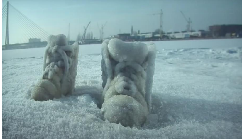
Resim 7. Sigalit Landau, "Salted Lake", Video, 2011.