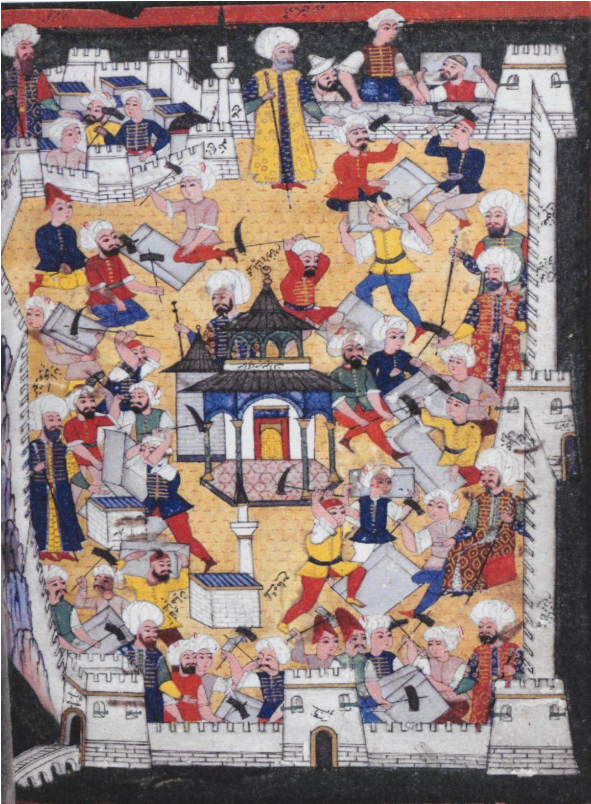
Ek.3: Gelibolulu Mustafa Âlî, Nusretnâme , Londra, British Muzeum H.1365, 199a.