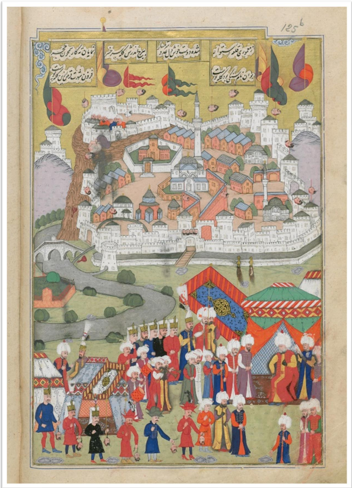
Ek:2-Seyyid Lokman, Şehnâme, Topkapı Sarayı, F 1404, 126.