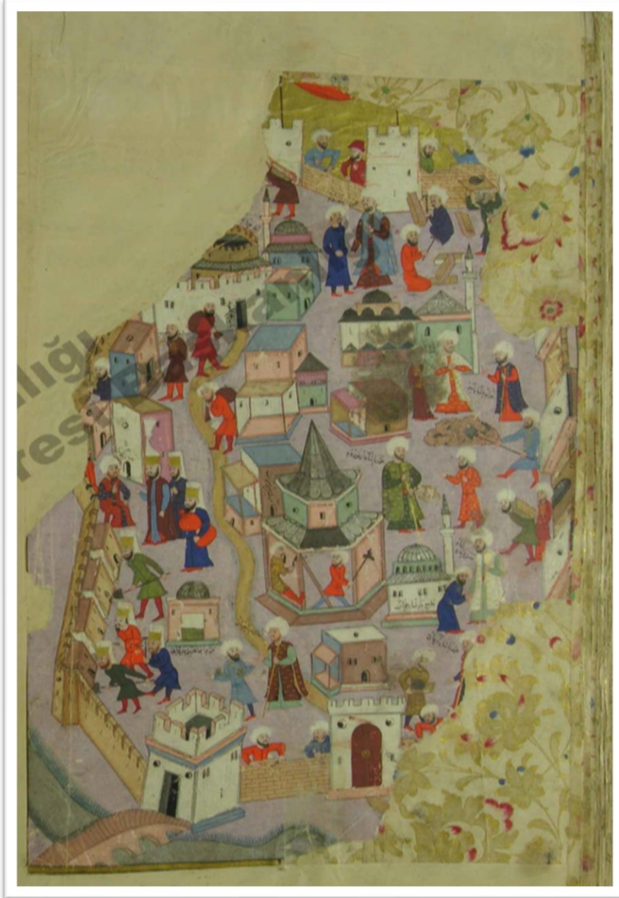
Ek:1-Nusretname, Topkapı Sarayı, H.1365, 228.