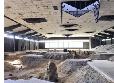
Şekil.9: P. Huyghes, After a Life