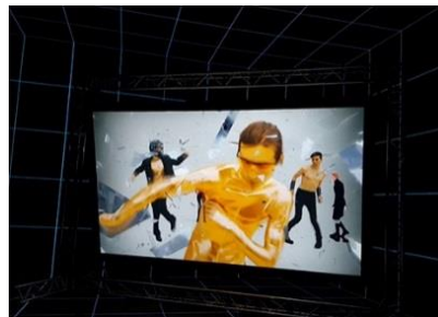
Şekil 2: H. Steyerl, Factory of the sun, 2015

http://marceliantunez.com/work/epizoo/ Erişim: 01.02.2019