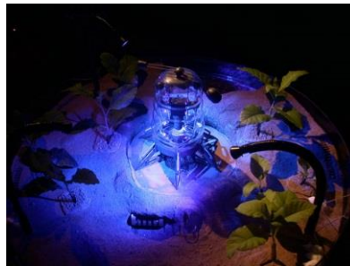
Şekil.8: E. Kac, Eighth Day, 2000