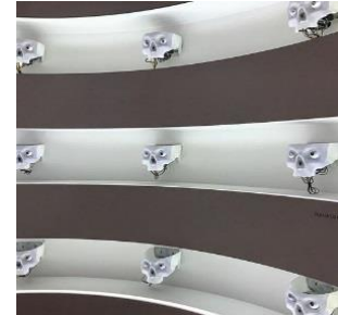
Şekil 3: L. Demers, Area

https://cmagazine.com/issues/130/hito-steyerl-factory-of-the-sun Erişim: 01.02.2019