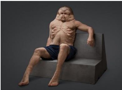
Şekil.7: P. Piccinini, Graham, 2016 Ahead 2017

https://www.patriciapiccinini.net/391/93/archiv.de/