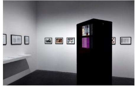
Şekil 6: J.van Loon, Cellout.me, 2015

http://www.cellout.me/ Erişim: 01.02.2019