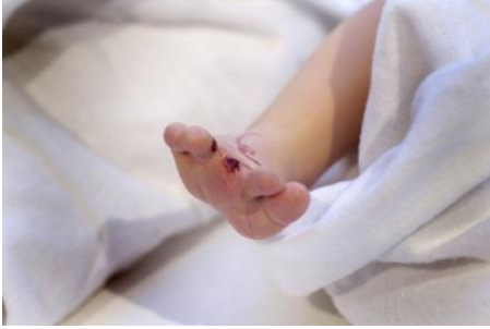
Şekil 4: A. Haines, Transfigurations, 2013

https://www.agihaines.com/transfigurations Erişim: 01.02.2019