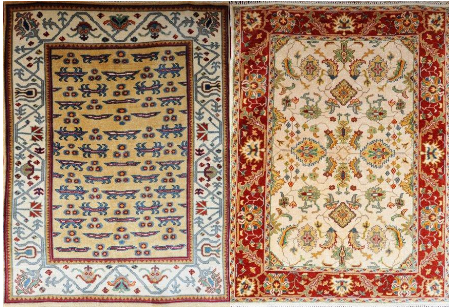
Resim 14: Çintemani Uşak Halısı, ( http://www.usak.bel.tr/sayfa/usak-halilari/ )

Bu halıların çeşitli kültürler tarafından kullanılan bu motif güneş, çintemani, ay ve bulut gibi çeşitli unsurları ifade etmek üzere kullanılmaktadır. Bordür de yer alan üç sekizgenden ve ejderhadan oluşan motiflerin ayı ve ayı koruyan ejderhayı ifade ettiğine inanılmaktadır. Halıda güneş, ay ve ejderha motiflerinin sembolik olarak kullanılması bereket temasının da işlendiği düşünülmektedir.