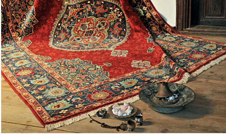
Resim 6: Madalyonlu Uşak halısı, ( https://www.turna.com/blog/gorenlere-usak-sehrini-hatirlatan-4-sey )

Uşak' ta üretilen en büyük ve en tanınmış grup halılar birçok Avrupalı ressamın Uşak'ta üretilen en bilinen halı örneklerini tablolarında yer vermişlerdir. Avrupa'daki seçkin aileler ünlü resamlara tablolarını yaptırırken Uşak halılarını duvarda, yerde ve masada dekor olarak kullanmaları bu halıların Avrupa'ya ihraç edildiği anlaşılmaktadır. Bir sanat eseri olarak tarihe imzasını atan, kültürel mirasımız el dokuma Uşak halısının dünya pazarında eski bilinirliğini artırmak gelecek yüzyıllara sanatsal bir miras bırakmak amacıyla tekstil alanında 2000'li yıllarda bir ilerleme kaydedilmiş ve yeniden fabrikalarda Uşak iplikleri üretilmeye başlanmıştır. Uşak halıları yıllara meydan okuyan geçmişi geleceğe taşıyan el sanatlarımız içerisinde yer alarak, dayanıklılığı ile sanat tarihinde yerini korumuştur. Halılar koruduğu sağlam yapısını natürel yün halı ipliklerinden alarak, Uşak'ta dokuma halı sektöründe faaliyet gösteren sayısı giderek azalan firmalarca üretimlerine devam edilmektedir.