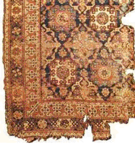
Resim 13: Holbein ve Lotto tipi Uşak Halısı, (MEGEP, Uşak Halısı Desenleri, 2012)

Holbein Uşak halılarda zemin kırmızı ya da laciverttir, orta alan, yaşamı ve doğurganlığı sembolize eden motiflerle bezenmiştir. Bordür, hayatı ve doğurganlığı korumak için kullanılan ve bulut şeklinde tasarlanmış olan ejderha motiflerinden oluşmaktadır.