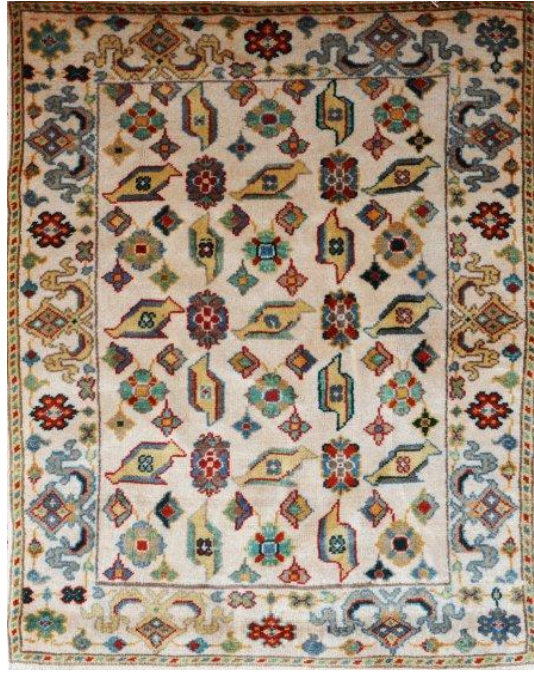
Resim 11: Kuşlu Uşak Halısı, ( http://www.usak.bel.tr/sayfa/usak-halilari/ )