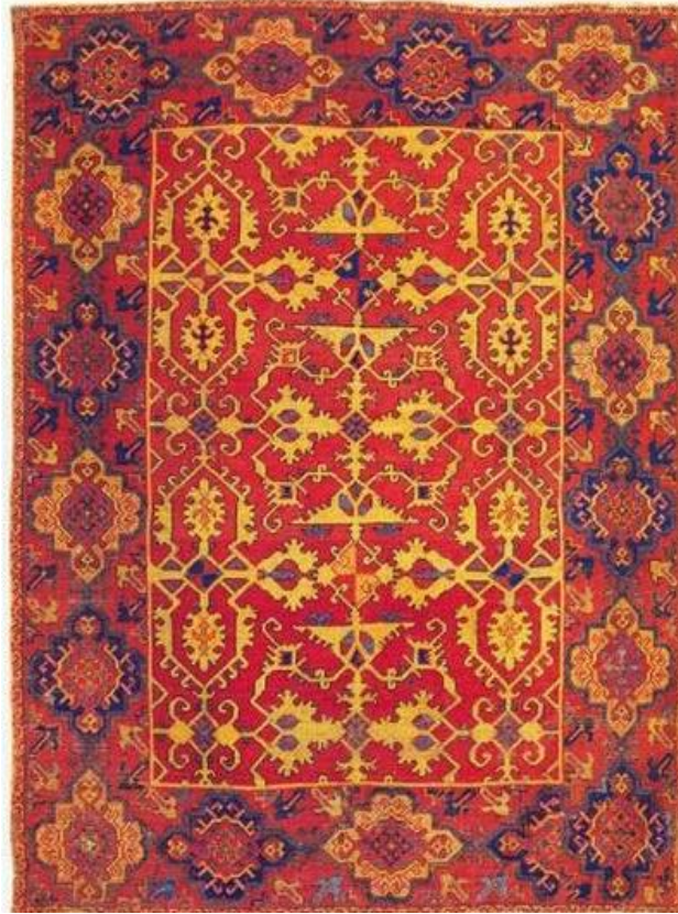
Resim 12: Lotto Uşak Halısı, ( http://eskiusakarastirmalarimerkezi.blogspot.com.tr/2013/10/lotto-tipi-usak-hallar-sadk-usakligil.html )

Lotto Uşak halısı dönemin ünlü İtalyan ressamı Lorenzo Lotto'nun tablolarında resmedilmiş ve ismini de bu sayede almıştır. Halıda kuş, ejderha ve hayat ağacı motiflerinin bir arada kullanılması ile ana tema oluşmuştur. Motiflerin bir arada kullanılması ile oluşan kompozisyon ruhun sonsuzluğu ve ölümsüzlük anlamını ifade etmektedir. Hayat ağacı üzerinde bezenen kuşlar, hayatı ve ruhu simgelemektedir. Ejderha motifinin kullanılması ise hayat ağacını koruyan hayvandır. Dokumada çiçek buketleri ile süslenmiş bordür yer almaktadır. Lotto halılarda zemin kırmızı, bitkisel motiflerde ise sarı rengin kullanılmıştır.