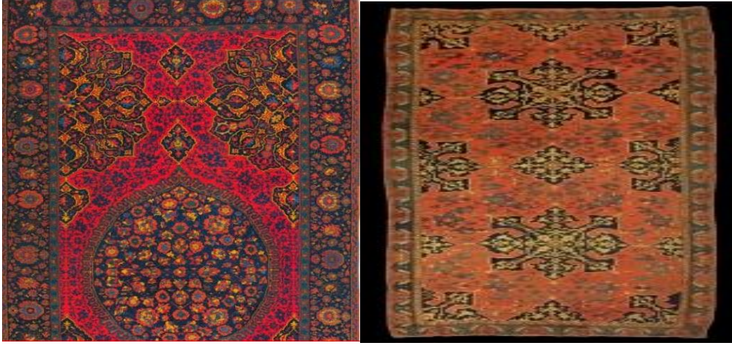
Resim 2: Madalyonlu Uşak Halısı