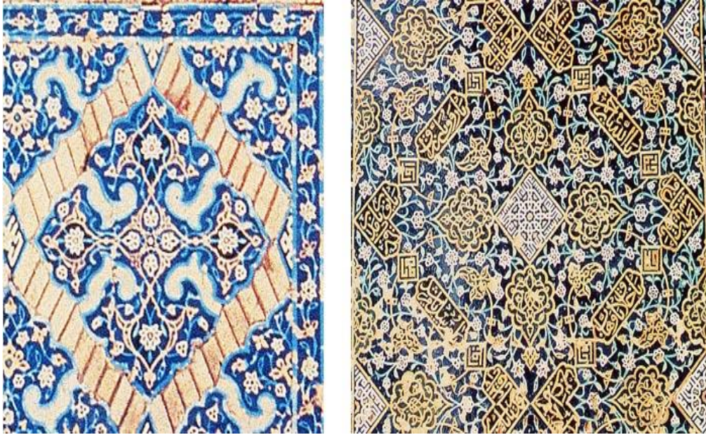
Resim 10: Tebriz Gök mescit çinileri, Uşak halıları Yıldız deseni öncüleri olan iki kiremit deseni, ( http://www.oturn.net/rugs/tor/alexander.html )