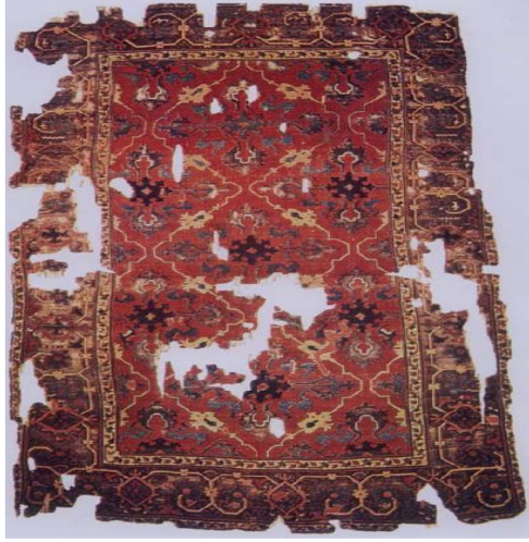
Resim 16: Çin bulutlu, baklava şemalı halı, 17.yy., Türk İslam Eserleri Müzesi, İstanbul, (Akın, 2009)

Yüzey üzerindeki simetrik şekiller buluta benzetildiği için motif ismini buradan almıştır. Motiflerin tekrarlı kullanılması hayatın sürekliliğini ifade etmektedir.