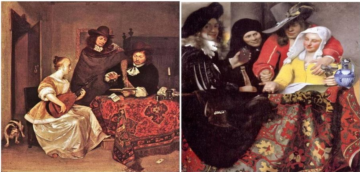
Resim 4: 1667-1668. G. Ter Borch. Theorbo çalan kadın. Ulusal Galeri Londra, ( http://www.turkoteke.com/old_masters/salon_5.html )