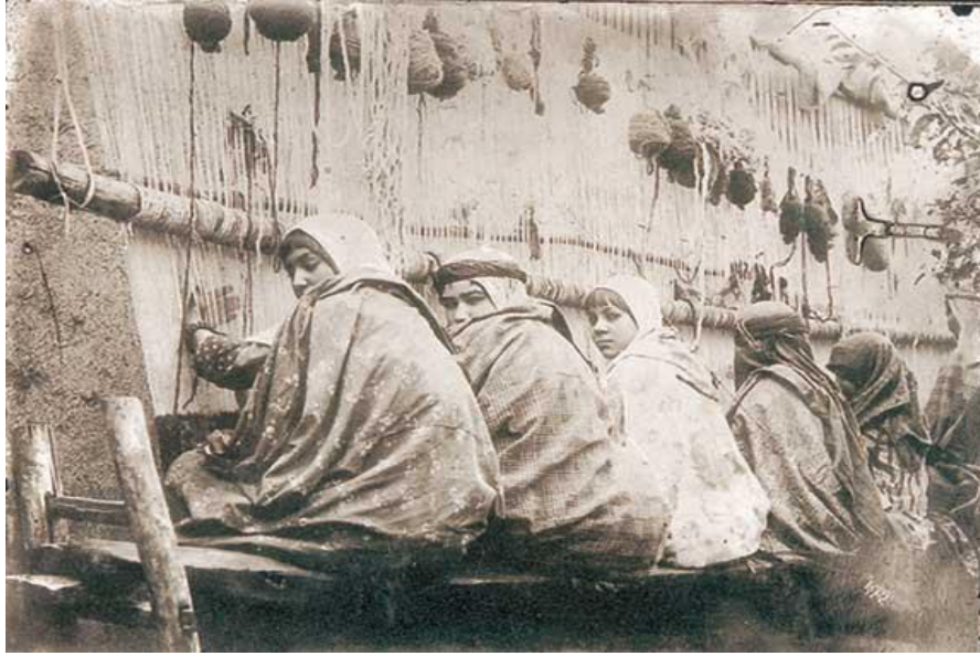
Resim 1: Halı dokuyan kadınlar, (Uçar, Demirkaya, & Doğan, 2015, s. 7)

Dokumacılık, tarihin ilk dönemlerinden itibaren günümüze kadar uzanan, köklü bir geçmişe sahiptir. Anadolu'da dokuma sanatı ilk çağlarda Lidya ve Frigyalılar döneminde başlamış en eski ve köklü Türk sanatlarından biridir. O dönemde bölgede yetişen hayvan yünleri iplik ve havlı dokumalar şeklinde değerlendirilmiştir. Binlerce yıl öncesinden günümüze kadar uzanan kullanım eşyası ve dekoratif amaçla da dokunan halı, tarihte ilk defa Türkler tarafından dokunduğu ve dünya medeniyetine hediye edildiği tespit edilmiştir (Taylan, 2013). Dokuma sanatı; göçebe çadırlarından, köy evlerine, hatta saraylara kadar uzanan, toplumun farklı kesimleri tarafından üretilmiş ve üretildiği yerde kullanılmıştır. Dokuma işleminde atkı ipliklerinin çözgü iplerinin içersinden geçmesiyle birlikte farklı bir desen ipliğinin farklı şekillerde düğümlenerek aynı hizada kesilmiş kadifemsi havlu yüzlü olan dokumaya halı denir.