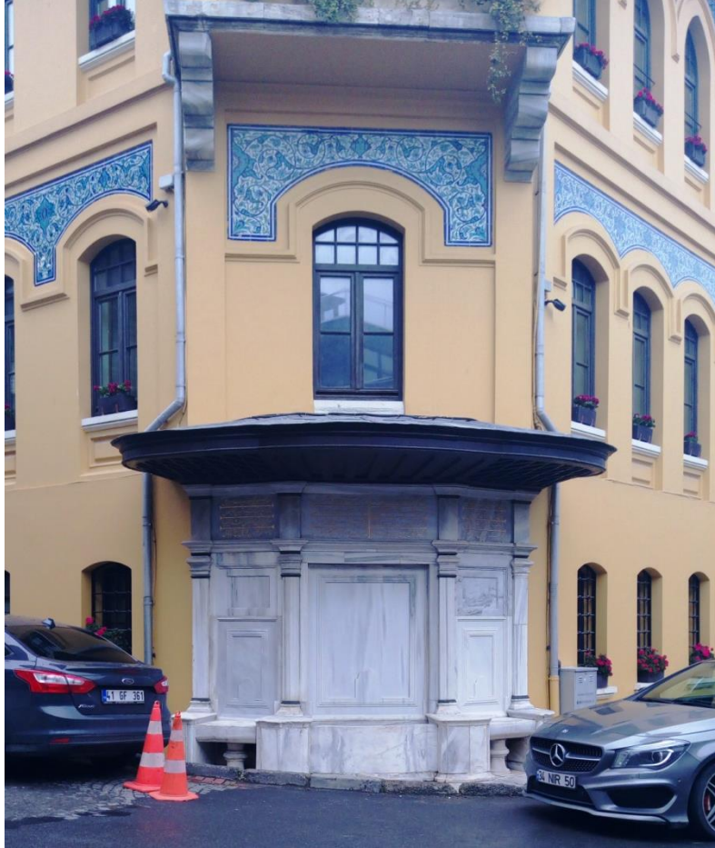
Resim 1. Nakşi Kadın Çeşmesi