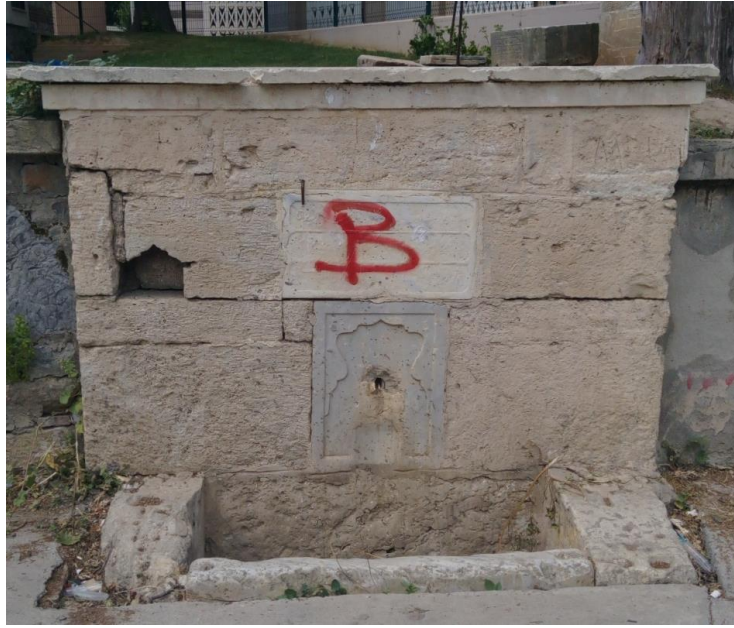
Resim 6. Nakşidil Valide Sultan Çeşmesi

Ayna taşı az derinlikli bir kırık kemer formundadır. Lülesi bulunan çeşmenin musluğu bulunmamaktadır. Kitabenin hemen batı tarafında su içmek için kullanılan tas yuvası yer almaktadır. Çeşmenin su teknesi günümüzde yolun yükseltilmesi ile bir kısmı toprak altında kalmıştır.