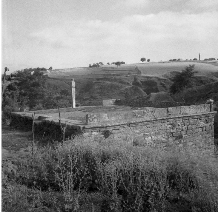
Resim 5. Namazgâhın arkadan görünüşü

Çeşmenin su haznesi üzerine inşa edilen namazgâhın etrafı taş korkuluklarla çevrilmiştir. Kırık kemer formlu kible taşında Sultan Abdülhamit'e ait olan tuğra yerinden sökülmüştür (Tiryaki, 2004: 417-418). Tuğranın etrafı akantus yaprakları, C kıvrımları ve karşılıklı lale motifleri ile süslenmiştir. Kitabe taşında “Küllemâ dehale aleyhâ Zekerriyye'l- mihrâb” “Zekerriyya mihraba her girdiğinde yanında...” âyeti (Âl-i İmrân 37) gövde kısmında içinde bitkisel motif bulunan bir vazo yer almaktadır.