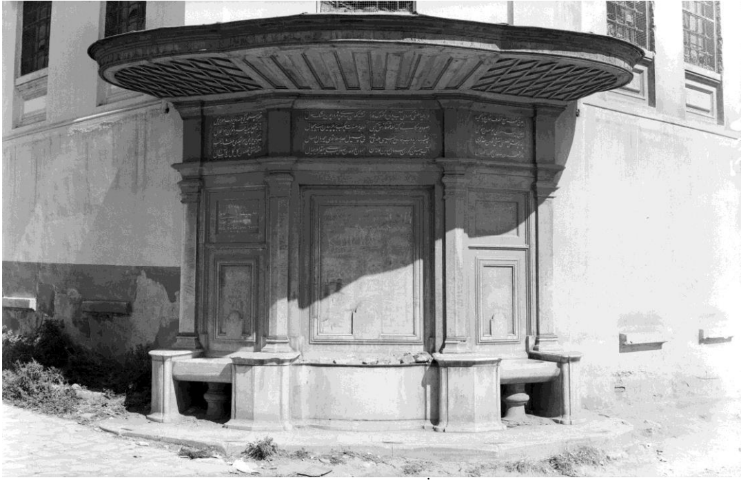
Resim 2. Nakşi Kadın Çeşmesi'nin 1944 yılındaki durumu (İstanbul Arkeoloji Müzesi Encümen Arşivi)

Yapıldığı dönemden günümüze değin sağlam ve bakımlı bir şekilde gelebilen çeşme ile ilgili Osmanlı dönemi arşiv belgeleri taramasında herhangi bir vesikaya ulaşılamamıştır. Ancak Anıtlar Yüksek Kurulu'ndan temin edilen bir belgede Cumhuriyet dönemi ile ilgili bilgiler yer almaktadır. Anıtlar Yüksek Kurulu'nun 02.04.2013 tarihli belgesine göre;