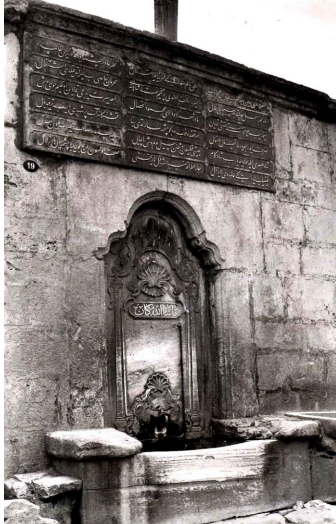
Resim 4. Çeşmenin 1936 yılındaki durumu

Yapıldığı dönemin süsleme anlayışını yansıtan çeşmenin en hareketli kısmı ayna taşından ibarettir. Ayna taşı kemeri kırık kemer formlu çok derin olmayan bir niş şeklidir. Kemerli niş içerisinde akantus yaprakları, istiridye kabuğu ve iki yanda S kıvrımlı korint başlıklı sütunçeler yer almaktadır. Ayna taşı kitabesinde “Mâşallâhu kâne”, “Allah’ın dediği olur” ibaresi yazılıdır. Çeşmenin su teknesi, oturma setleri ve yalakları yolun yükseltilmesi ile bir kısmı toprak altına gömülmüştür (Köse ve Meyveci, 2017: 150 - 151).