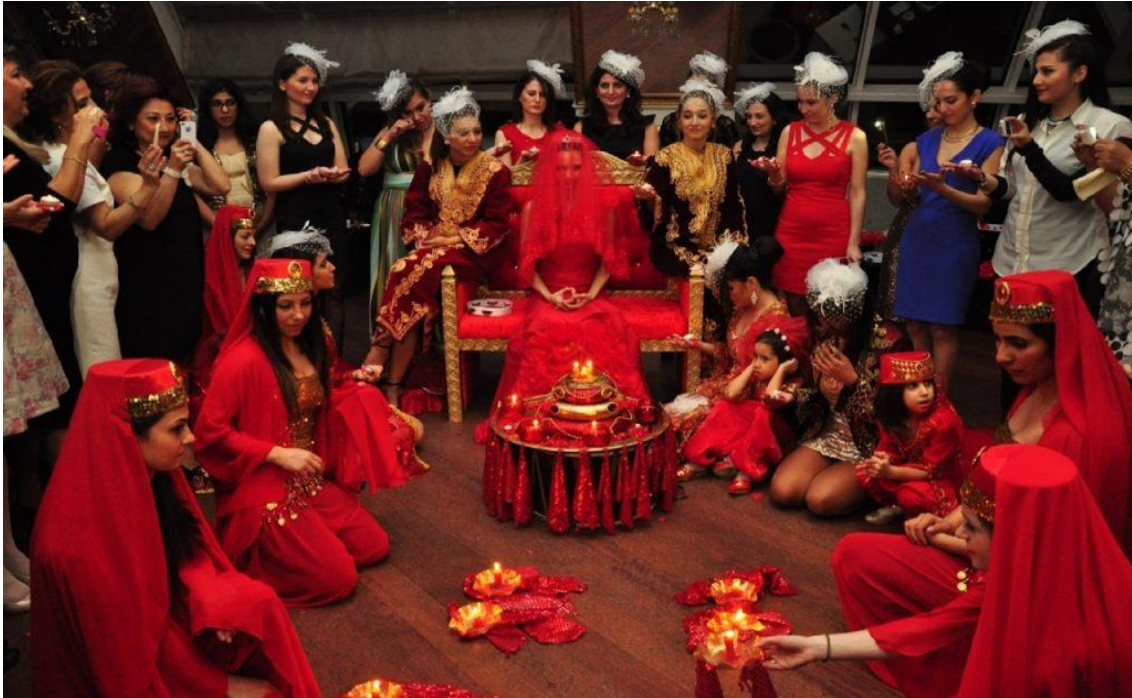
Resim 2.3 Azerbaycan'da Kına Gecesi Töreninden Bir GörSEL

Halkın eski dönemlerden bugüne kadar koruyup kolladığı zengin ve renkli düğün törenlerinden biri de “kına yakıtı” törenidir. Bu törende yalnızca kadınlar ve kızlar davet edilmektedir. O gece gelinin eline, ayaklarına kına sürdükten sonra törene gelen kızlar, gelinler de gelinin kınasından ellerine yakarlardı. Bu törende şaka nitelikli, mizah ve çeşitli oyunlar gösterilmektedir, Gecedden sabaha kadar süren töreni neşeli bir atmosfer kaplamaktadır. Eski görüşlere göre, kına gecesinden itibaren gelinin saadeti - mutlu günleri başlardı (Azərbaycan etnoqrafiyası, 2007: 415). Masallı bölgesinde kına yakıtı törenine kız başı denilmektedir. Kırmızı elbise, ele kına yakmak halk arasında sevinç ve mutluluk sembolü olarak kabul ediliyor. İlginç gerçeklerden biri de “bir zamanlar Azerbaycan'da nişanlı erkek ve kızların bilinmesi için kırmızı renkli kıyafetler giymiş olduklarıdır. Erkek tarafından kız için kırmızı renkli elbise götürülmüş, kız da nişanlısı için kırmızı renkli gömlek öreerek yollarmış. (Azerbaycan Etnoqrafiyası, 2007: 429).