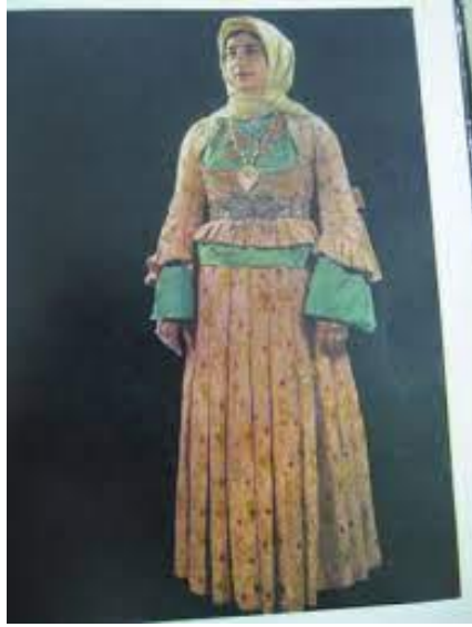
Resim 4.4 : Garabağ yöresi kadın kıyafetleri