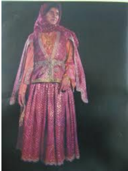
Resim : 4.3. Arkalık ve Tuman