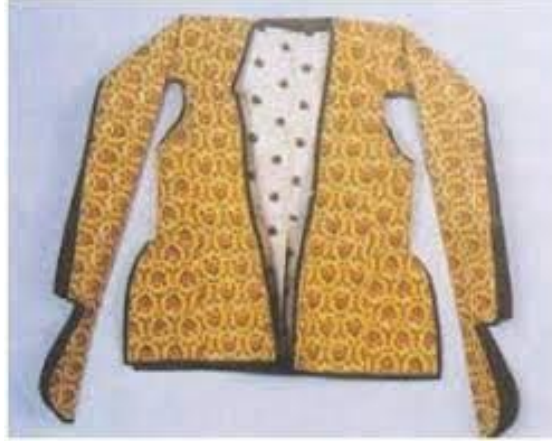
Resim 4. 2: Azerbaycan Halçası ve Halk Tatbiki Sanat Devlet Müzesinden 19.yy ait cepken.