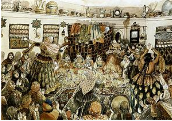
Resim 2.1. Azim Azimzade'nin "Düğünde Kadınlar" isimli 1930 yılına ait resmi

verdikleri önemi göstermektedir. Düğünler bir çırpıda yapıp bitirilmez. Düğünün başlangıcı ve bitmesi arasında birçok törenler yapılır ve bu törenlerde uyulması gereken kurallar vardır. Evlilikle ilgili yapılmış çalışmaların bir kısmında, konu genellikle evlenme/ evlilik öncesi, evlenme/evlilik ve evlenme/evlilik sonrası şeklinde üç bölüm olarak incelenmektedir. Bilindiği gibi ülkemizde görücü usulüyle evlenme, kız kaçırma, beşik kertme evliliği, berder evliliği (berdel), ölen kardeşin karısıyla evlenme (levirat evlenme), baldızla evlilik (sorarat evlilik) gibi evlenme biçimleri bulunmaktadır.