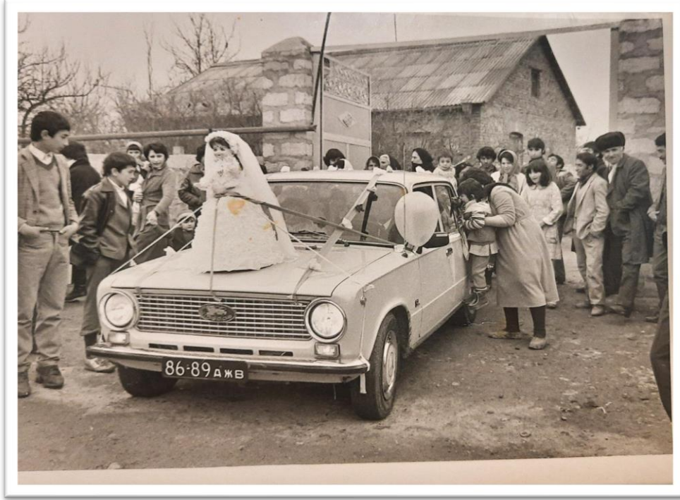
Resim: 6.1. Damat evinden çıkıp, gelin alma töreni

Azerbaycan'da düğün merasimleri geçmişte günümüze kadar gelenek ve göreneklerini korumaya devam etmektedir. Aşağıda paylaştığımız fotoğraflar tamamen Azerbaycan'da doğup büyümüş kişilerin düğün törenlerinden alınmış ve makalemize yerleştirilmiştir. Gelin almaya giderken arabanın üzerine oyuncak bebek figürü yerleştirilir ve araba süslenirdi. Gelin evden çıkartılırken büyük bir kalabalık toplanır. Gelinin belinde bekaretliği temsil eden kırmızı kurdela bağlanır. Gelin evden çıkarken yüzü yere bakar. Gelin beyin evine geldiğinde önünde kurban kesilmektedir.