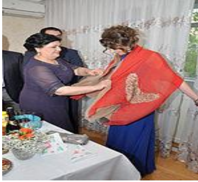
Resim: 2.2. Gelinin Omuzlarına kırmızı bir fular atmak Azerbaycan'da bir nişan geleneğidir.

da heride takılıyordu. Erkek tarafı kıza taşlı yüzük getirir ve böylece kız herili bilinmektedir. (Sarabski, 2006: 34).