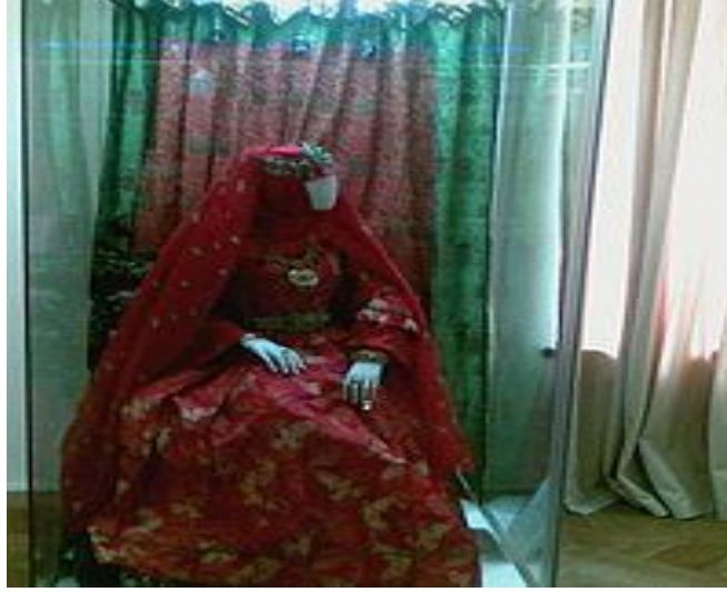
Resim 3.5. Azerbaycan Ulusal Tarih Müzesi' Geleneksel Azeri Giysisi

Düğün törenlerinin bir sonraki aşaması “kebin kesme” törenidir. Düğünden önce mutlaka dini nikah (kebin) kıyılması gerekmektedir. XIX yy. sonu XX yy. başlarında nikah düğünden önce camide hoca tarafından kıyılır. Törende çoğunlukla erkek ve kız tarafından iki kişi adam (avukat) ve diğer kişiler de yer alır. Kızın avukatı kızın nikahı kabul ettiğini hocaya söylerdi ve erkek tarafından belirlenmiş sayıda altın para talep edilmektedir. Daha sonra hoca Fatıha-hayır nikâh duasını okur ve nikah kıyardı. Kebinde altın paranın, yani mehrin miktarı yazılıyordu. Nitekim boşanma gerçekleştiği takdirde erkek nikah kağıdında belirtilen altın parayı kıza vermek zorundadır. Kebin çoğunlukla kız evinde kıyılır ve damat taraftan gelmiş birkaç yaşlı erkek ve kızın ailesi için nikâh sofrası kurulmaktadır. (Quliyeva, 2011: 26).