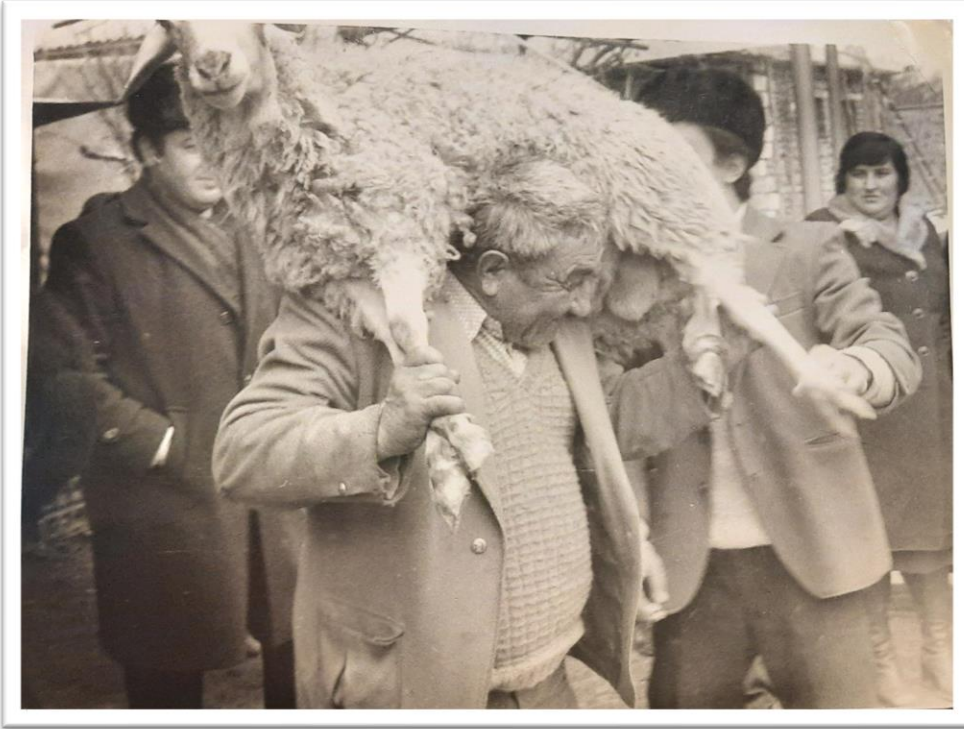
Resim: 6.2. Gelinin bey evine geldiğinde kurban kesilmektedir. Bu gelenek günümüzde halen devam etmektedir.