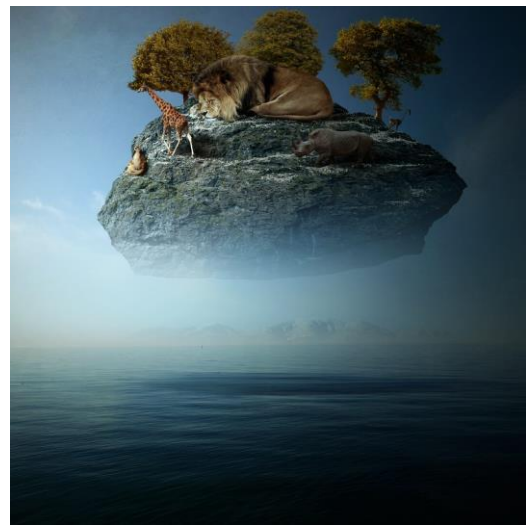
Resim 5. Fantastik İllüstrasyon (URL8)