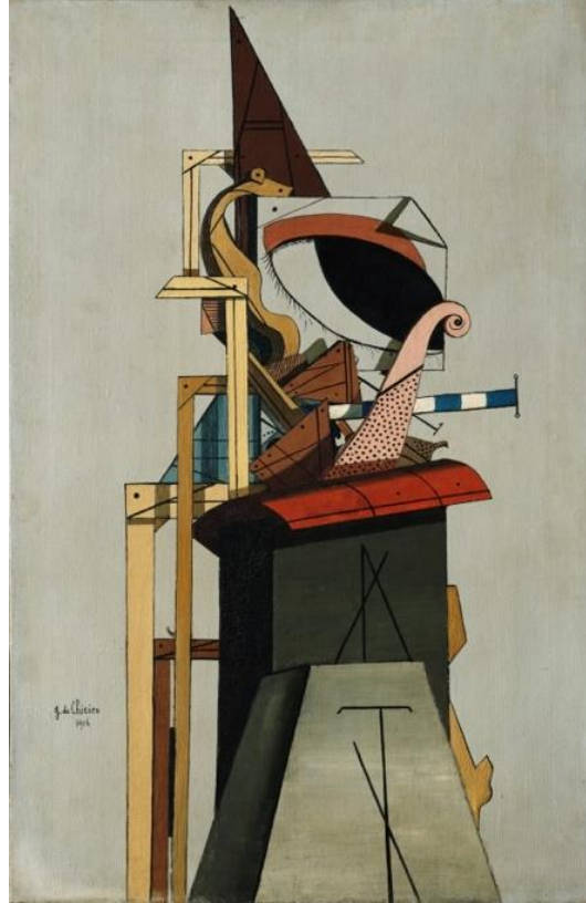
Resim 1. “The Jewish Angel”, Giorgio de Chirico, 1916 (URL4).

Sürrealist resimlerde kişinin kendi hayal dünyası ve şuurlaltı ön planda tutulduğu için bu akıma mensup sanatçıların hiçbiri diğerinin ne tür bir iş ortaya koyduğu ile ilgilenmeden, kendi iç dünyasındakileri ön plana çıkarmak için çaba göstermektedirler. Bu bağlamda Sürrealist resimlerde ucu bucağı olamayan mekân yaratma hissi vuku bulmuştur. Çünkü rüyalarda ve bilinçaltında beliren resimlerde bir başlangıç ve son yoktur. Gerçekten de bu akıma bağlı ressamların çalışmalarında geniş bir mekân hissi yaratıldığı görülmektedir.