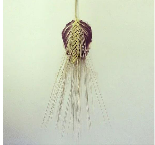
Resim 7. Dudi Ben Simon, Different Image 1, 2014 (URL9).

Sanatçı, Resim 6. de külahın üzerine kabloyu dolayarak dondurma hissini bize farklı bir şekilde hissettirmektedir. Resim 7. de ise çizimin üzerine bir başak yerleştirerek hem kadının saç yapısına dair hissiyat hem de başak ve kadının benzetimini farklı bir illüstratif gerçeküstü bir soyutlama ile ortaya koymuştur.