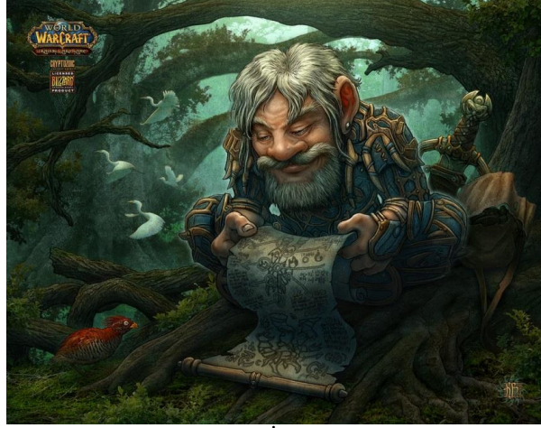
Resim 3. Fantastic İllüstrasyon (URL7).

İllüstrasyon günümüzde kullanım alanları açısından oldukça çeşitlilik göstermektedir. Tarz olarak günümüz illüstrasyonlarının ilk örneklerinin 2. Dünya Savaşı sırasında, ülkelerin, halklarını savaşa hazırlamak ve destek vermesini sağlamak için propaganda unsuru olarak kullandığı afişler olduğunu söyleyebiliriz. Halen güncelliğini koruyan pin-up tarzı da bu dönemde ortaya çıkmıştır. Bu akımın etkisiyle genellikle ilk illüstrasyon örnekleri oldukça siyasi amaç gütmekteydi ancak bir süre sonra bu algı kendisini ticarete ve sanata bırakmıştır.