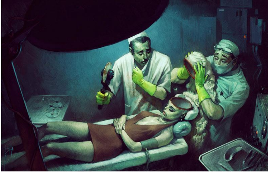
Resim 8. Vladimir Kazak, “The mont” (URL10)

Her geçen gün geliştirilen ya da bir yenisi piyasaya sürülen bilgisayar programlarıyla hem iki boyutlu hem de üç boyutlu sanal bir ortamda çalışma olanağı yakalamıştır. Sanatçı ya da tasarımcı elde ettiği ürünü gelişen teknolojinin sunduğu çeşitli cihazlar vasıtasıyla iki ya da üç boyutlu şekilde çıktı alınarak gerçek dünyada da sergileme şansını yakalamıştır. Resim 8’de yer alan Bilgisayar destekli tasarım programı olan Autodesk Sketchbook programıyla çalışılmış bir illüstrasyondur. Bu illüstrasyon daha çok gerçeğe yakın, betimleyici, mesaj verici, etkileyici ve sürrealist görüntüsüyle dikkat çekmektedir.