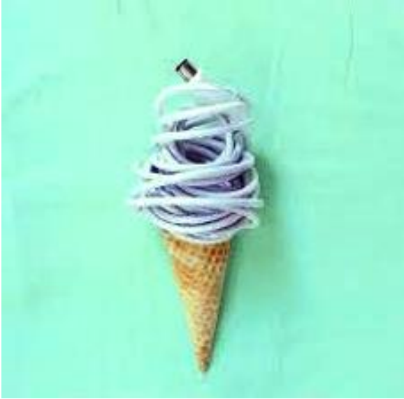
Resim 6. Dudi Ben Simon, Different Image, 2014 (URL9).

Kavramsal sanatta sanatçı fikrini ortaya koymak için her türlü malzemeyi kullanabilir. Bu bazen gündelik bazen eşsiz, garip nesnelere izleyicide zihinsel bir sürecin içine girmesini arzular. İsraili sanatçı Dudi Ben Simon'un çalışmaları (Bkz; Resim 6 ve 7.).