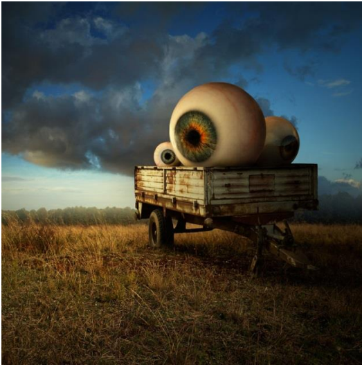
Resim 4. Fantastik İllüstrasyon (URL8)

Günümüzde illüstrasyon çok farklı boyutlara ulaşmıştır. Günümüz sürreal illüstrasyonlarını incelendiğinde gerçek olmanın yanı sıra bazen insan aklını zorlayan türde çalışmaları görmek mümkündür.