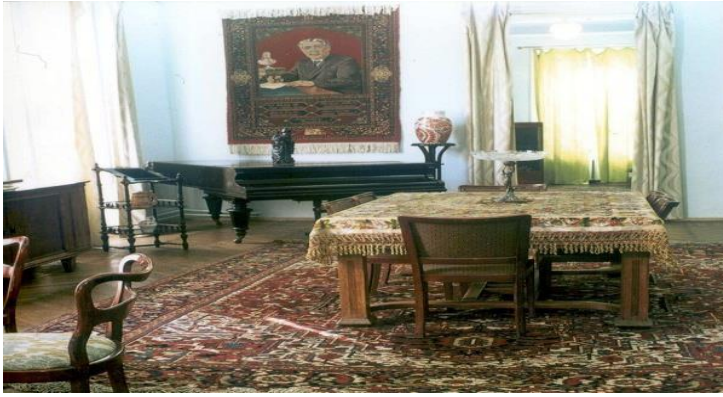
Şekil 2. Samet Vurgun Ev Müzesi, Misafir Odası. http://samedvurgun.az/az/sem-d-vurgun/sekiller/muzey (Erişim tarihi: 26.01.2022)