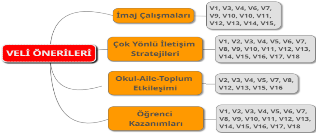
Şekil 2. Kültürel Diplomasi Faaliyetlerine İlişkin Veli Önerileri

Kültürel Diplomasi Faaliyetlerine İlişkin Öneriler teması, İmaj Çalışmaları (n=14), Çok Yönlü İletişim Stratejileri (n=18), Okul-Aile-Toplum Etkileşimi (n=10) ve Öğrenci Kazanımları (n=18) alanlarında kategorilere ayrılmıştır.