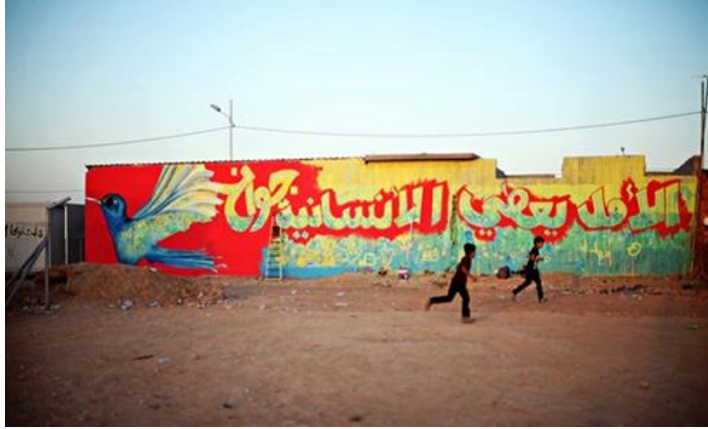
Resim 6. “Umut İnsanlığa Kanat Verir”, Hatların Dışını Boya Projesi, Irak Kürdistan Bölgesi