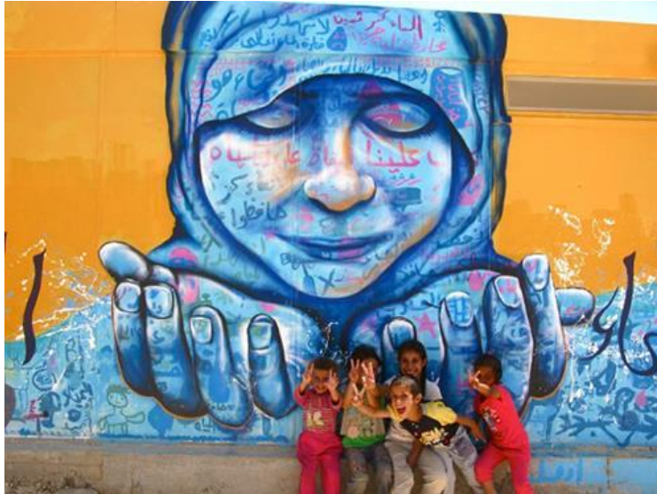
Resim 4. Joel Artista, Za'Atari Projesi, 2013, Za'Atari Suriye Mülteci Kampı, Ürdün

Doğal ortamda gerçekleştirilen bu sanatsal projeler için “sokak sanatı” ifadesini kullanmak yanlış olmasa gerek. Yaşamı ve eylemi bünyesinde barındıran sokak sanatı aktivistleri, yaşadıkları toplumun açmazlarına olan duyarlılıklarını sistem eleştirilerinde bulunurken, yaptıkları işlerle göstermektedirler. Alt kültürlerin ve sosyal hareketlerin sistem eleştirilerini ifade etmek ve çoğunluğun dikkatini üzerine çekmek amacıyla yapılan işleri kapsayan sokak sanatı, genellikle mesaj verme kaygısı taşır. Bu bağlamda, toplumsal farkındalık yaratmaya çalışan bu sanatsal projeler ile sokak sanatının ortak amaçlara sahip olduğunu söyleyebiliriz (Güneş, 2009:44).