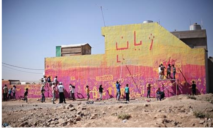
Resim 5. Hatların Dışını Boya Projesi, Irak Kürdistan Bölgesi

Hatların Dışını Boya Projesi, Irak kamplarının Kürdistan bölgesinde aptART ve ACTED'den ulusal ve uluslararası sanatçıları getiren UNİCEF ve ECHO ile kendi topluluklarında yaratıcı bir çıkış yapmaya istekli olan gençleri cesaretlendirmek için bölgesel gerçekleştirilen bir sokak sanatı projesidir( https://www.unhcr.org/innovation/7-art-initiatives-that-are-transforming-the-lives-of-refugees ).