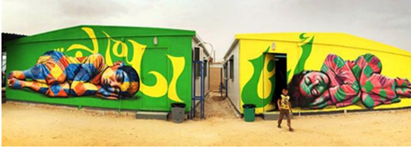
Resim 3. Joel Artista, “Hayal Ediyorum”, Za'Atari Projesi, 2014, Za'Atari Suriye Mülteci Kampı, Ürdün

Za'Atari kampındaki bu çocukların bir zamanlar mutlu, bir arada, huzurlu, canlı, renkli, normal yaşamlarını insani şekilde sürdürdükleri bir anavatanları vardı. Ancak sebebini dahi bilmedikleri savaşın onlardan tüm bunları alıp götürmesi, onları planlanmamış, kaygı ve sorularla dolu belirsiz yeni bir hayata mecbur bırakmıştır. Yaşam kalitesini ifade eden birçok özelliği geride bırakmak zorunda kalan bu insanlar, artık sadece hayatta kalabilme ve bu süreçte karşılaştıkları sorunlarla mücadele edebilme derdine düşmüşlerdir. Bu zorlu süreç içerisinde bireyin umudunu kaybetmemesine yönelik gerçekleştirilen bu tür sanatsal ve sosyal projelerin önemi oldukça büyüktür. Za'Atari Projesinde de özellikle çocukların projeye dahil edilerek seslerini yaratıcı etkinliklerle duyurabilmelerini sağlamak, onların gelecek için sağlıklı bir toplumda rol oynamalarına katkıda bulunulmaya çalışılmıştır.