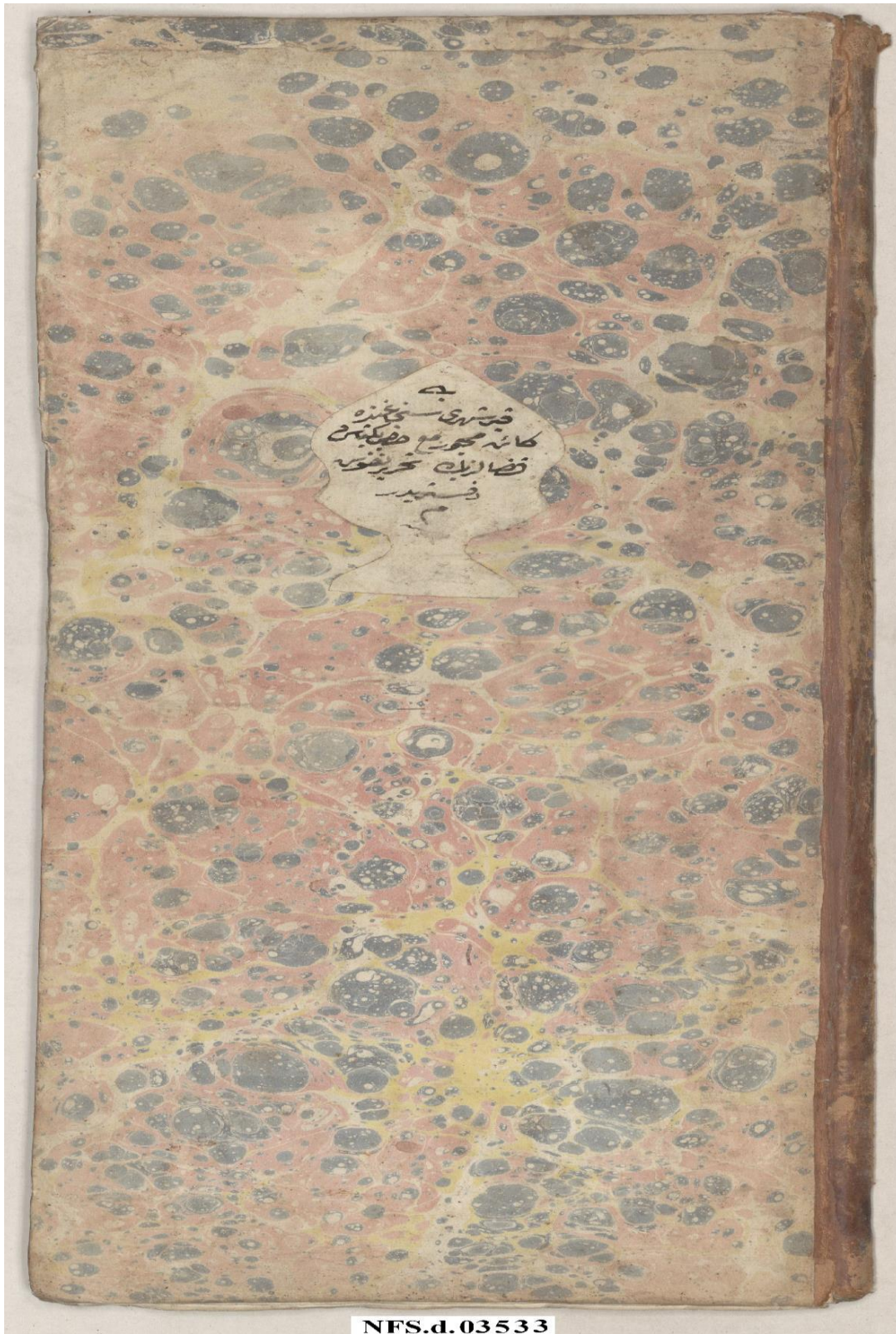
Ek 3. Nfs.d.; 3533Sıra Numaralı Kırşehir Nüfus Defteri, Sayfa,01.