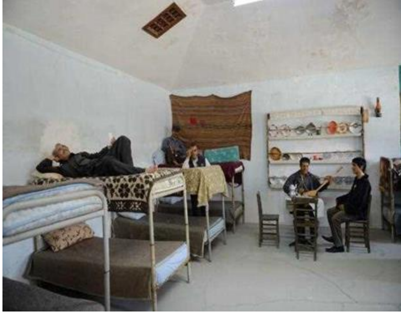
Resim 3. Hilton Koşu