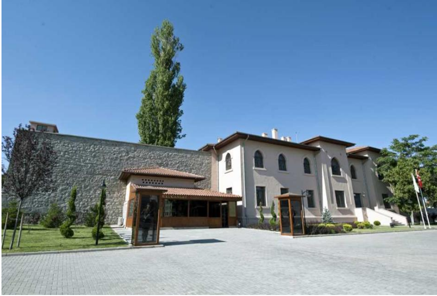
Resim 1. Ulucanlar Cezaevi