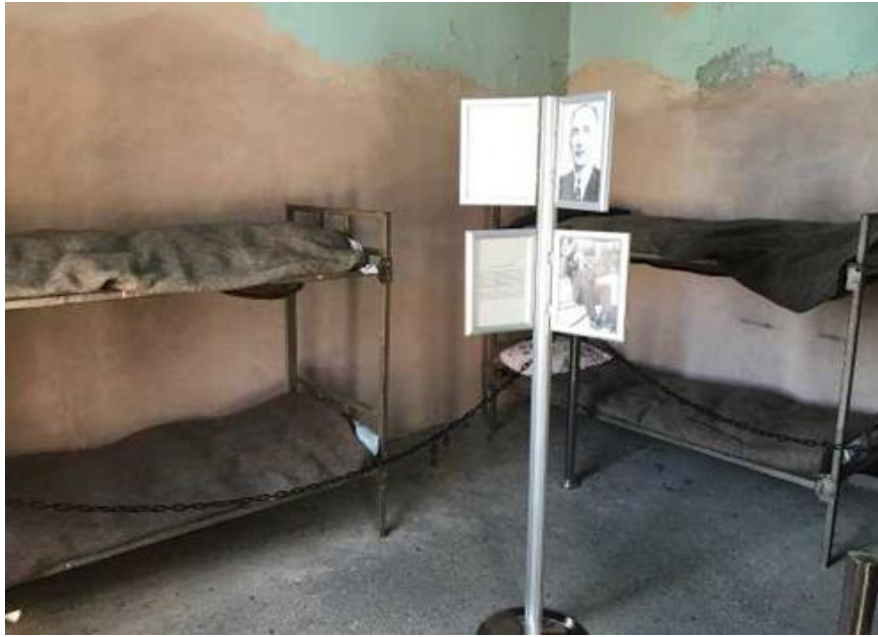
Resim 2. Ulucanlar Cezaevi Koğuş

Cezaevi, yaşanan dramlar, hayat hikâyeleri ve idamların yanında, mahkûm olarak ağırladığı kişilerin bilinirliğiyle de ünlenmiş ve ziyaretçiler için merak konusu olmuştur. Türk siyasetçileri, öğrenci liderleri, yazar ve şairlerin mahkûm olduğu tarihi cezaevi önemli idamlara sahne olduğu için Türkiye'nin siyasi ve edebi tarihi açısından önem taşımaktadır (Çetinsöz, 2017).