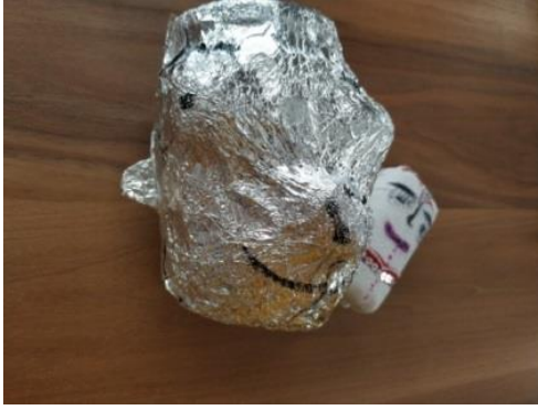
Resim 8 : Umay'ın 5 numaralı çalışması