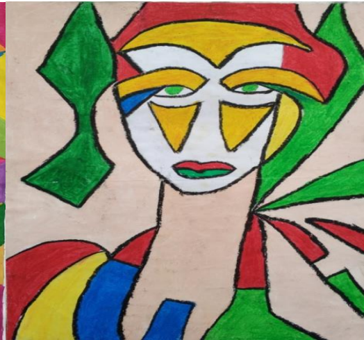
Resim 7: Demet'in 3 numaralı çalışması