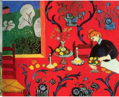
Resim 4: Henri Matisse "The Red Room (Kırmızı Oda)" 1908, tuval üzeri yağlıboya, 180 x 220 cm. Hermitage Müzesi, St. Petersburg

Öğrencilere ikinci hafta Henri Matisse "Kırmızı Oda"(Resim 4) adlı eseri incelemişlerdir. Öğrencilere eseri incelemeleri ve pedagojik sanat eleştirisi basamaklarını uygulamaları için iki ders saati verilmiştir.