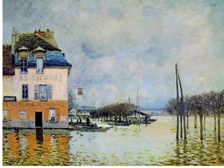
Resim 3: Alfred Sisley "Port Marly'de Sel Baskını" 1876, 81 x 60 cm. tuval üzerine yağlı boya Orsay Müzesi, Paris.

İlk hafta Alfred Sisley'e ait olan "Port Marly'de Sel Baskını" (Resim 3) adlı eser öğrenciler tarafından incelenmiştir. Öğrenciler belirli bir süre akıllı tahtadan açılan ve sınıfa getirilen eserin tıpkıbasım fotokopilerinden eseri incelemişlerdir.