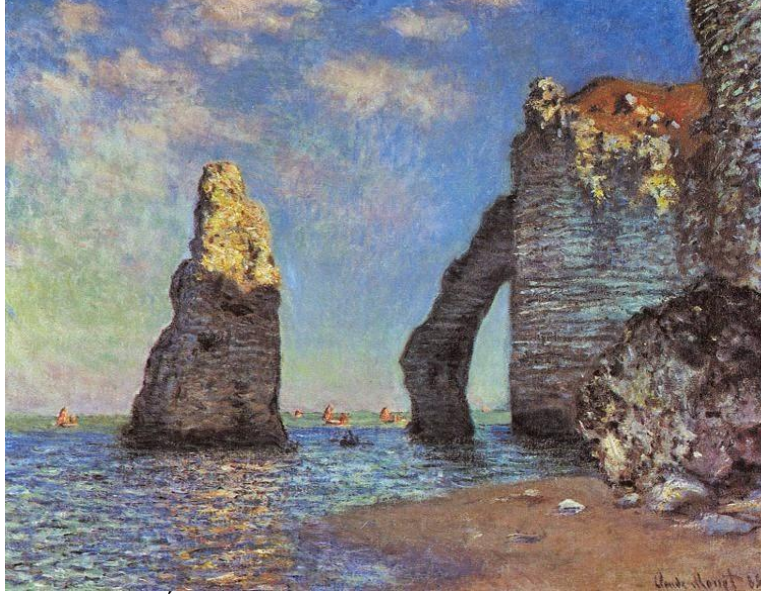
Resim 1: Claude Monet, Fırtınadan sonra Étretat'ta Uçurum, 1885, Clark Sanat Enstitüsü, Williamstown, Massachusetts