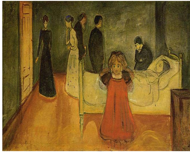
Resim 2: Ölü Anne ve Çocuk, 1899, Much, yağlıboya, 104,5 x 179, 5 cm. Munch Müzesi.