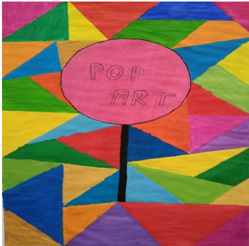
Resim 6: Nükhet'in 2 numaralı çalışması

Bu tema altında öğrencilerin resimleri içerisinden seçtikleri bir ürün ele alınarak hangi sanat akımından etkilendiklerine dair görüşlerine yer verilmiştir. Öğrenciler resimlerini teslim ederken kâğıtlarının arkasına resmi neden yaptıklarını açıklamışlardır. Öğrencilerin sanat akımlarını uygulama koduna dair görüşleri şu şekildedir;