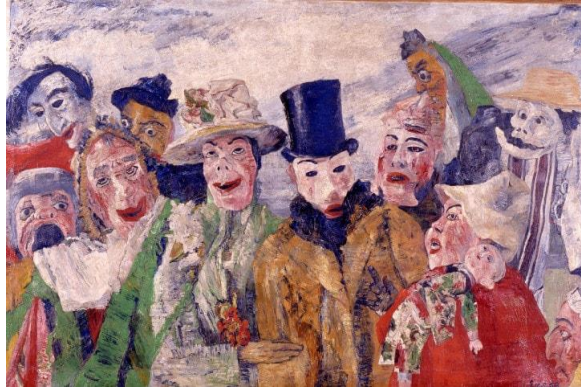
Resim 5: James Ensor'un "Entirika" 1890, tuval üzerine yağlıboya, 90 x 150 cm. Güzel Sanatlar Müzesi, Anvers

On birinci hafta da (7 Mart 2019) ise James Ensor'un "Entirika" adlı çalışması ele alınarak öğrenciler tarafından pedagojik sanat eleştirisi yöntemi kullanılarak incelenmiştir.