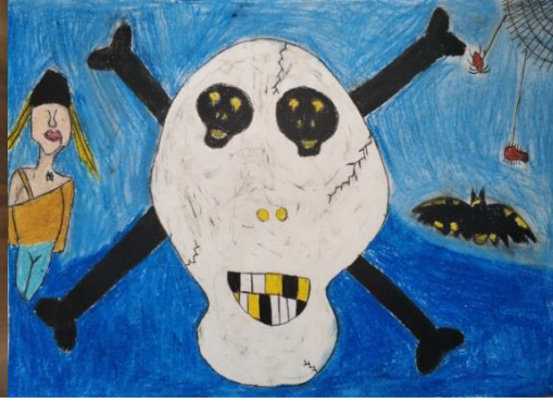
Resim 9: Derya'nın 3 numaralı çalışması

Nükhet'in 2 numaralı çalışması için (Resim 6); "Pop-art ve kübizmden etkilendim. Bu bir lollipop reklamı, sevdiğim akımlarla ilgili resim yaptığım için mutlu oldum."