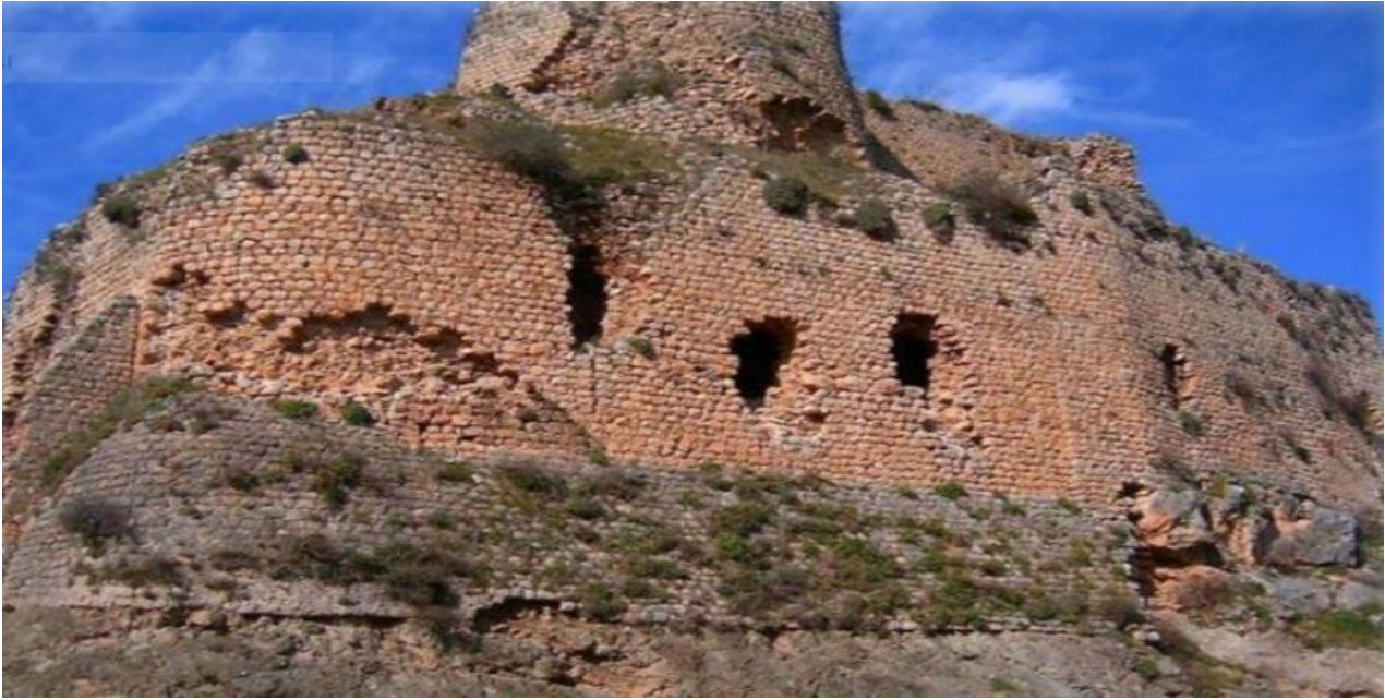
Fotoğraf 2.3. Mancınık Kalesi

1290'lı yıllarda yapılan Mancınık Kalesi, Amanos dağlarında ormanların içinde inşa edilmiş geçmişten bugüne tarihi kalıntılarını koruyan kaledir. Dört Yol' un kuzeyine düşmektedir.