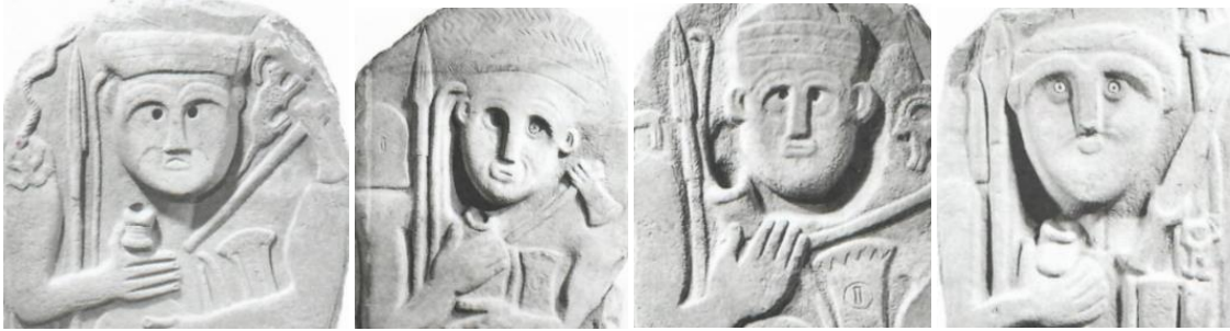
Resim 6. Elllerinde kap tutan Hakkari stellerinden örnekler