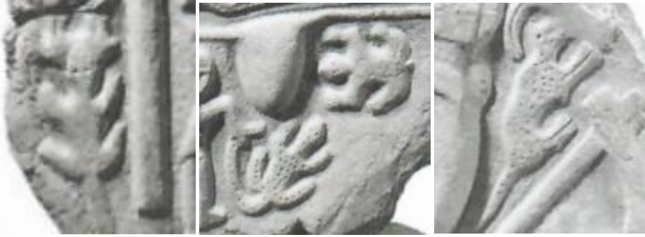
Resim 13. Hakkâri stellerinde yer alan pars betimlemelerinden örnekler

yer alan parsları güç kudret ve üreme sembolleriyle değerlendirebiliriz. Parslar stellerdeki savaşçıların güçlerini ve bunun hangi boyutta olduğunun birer göstergesi olarak kabul edilebilir.