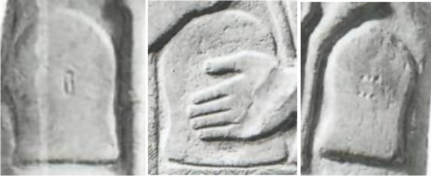
Resim 9. Hakkâri stellerinde yer alan çadırlardan örnekler