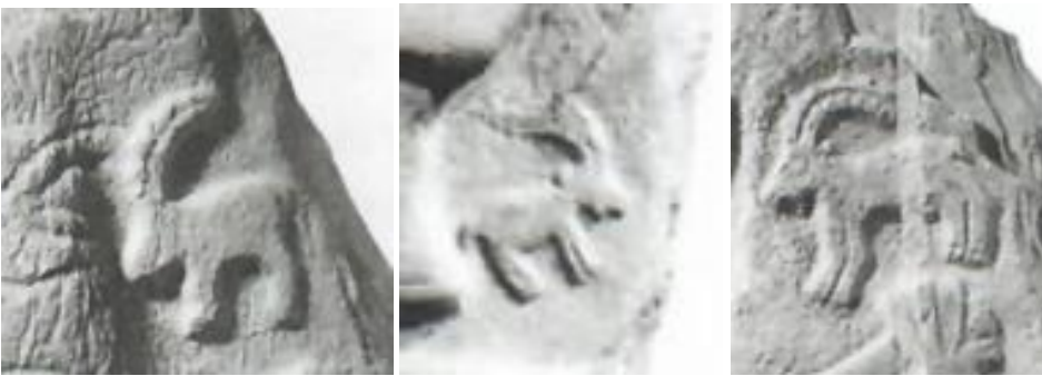
Resim 12. Hakkâri stellerinde yer alan keçilerden örnekler