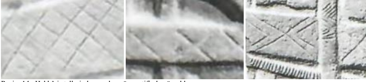
Resim 14. Hakkâri stellerinde yer alan göz motifinden örnekler