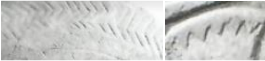
Resim 14. Hakkâri stellerinde yer alan suyolu motifinden örnekler

Su hayatın devamlılığında olmazsa olmazlardandır. Bu sebeple bütün uygarlıklar suyun olduğu yerde kurulmuştur. Suyun insan yaşamı için önemi onu farklı şeylerin temsili olarak kullanılmasına neden olmuştur. Su temizliğin yanı sıra ruhsal arınmanın da bir semboldür. Birçok dinde arınma kutsanma su aracılığıyla yapılmaktadır. Su bereketi simgeler. İnsanların yanı sıra hayvan ve bitkilerin yaşamını devam ettirmesinde yani doğanın devamlılığında sağlar. “Su, yeniden doğuşun, bedensel ve ruhsal yenilenmenin, yaşamın akışkanlığının ve sürekliliğinin, bereket, soyluluk, bilgelik, saflık ve erdemın sembolüdür. Anadolu’da su yaşamın kendisidir. Anadolu kadınının bütün gün iç içe olduğu su, dokumalarında motif olmuştur” (Kayabaşı ve Diğerleri, 2016: 48). Suyolu olarak adlandırılan motif, aynı birimden oluşan ve bu birimlerin tekrarının içerir. Bu motifler örgü ve dokumadan oluşan eşyalarda, mimari gibi alanlarda özellikle doğu kültürlerinde kullanılır. Suyolu motifinin stellerde (Resim 13) yer alan kıyafet ve eşyalarda kullanıldığı görülür. Bu motifle süreklilik, devamlılık, sonsuzluk vb. gibi suyun içerdiği sembolik anlamların kişiye yüklendiği düşünülür.