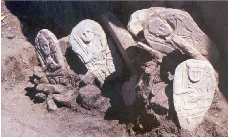
Resim 3: Hakkari stellerinin bulunduğu ilk hali

Hakkâri stellerinin, üzerinde biçimlendirilen şekillerden yola çıkıldığında savaşçılar için dikilen yapılar olduğu düşünülmektedir. Bu düşünceye yol açan unsurlar ise stellerin üzerinde betimlenen kişilerin hançer, kılıç, ok, yay, balta, gibi nesnelere tasvir edilmesidir. Hakkâri stelleri, biçimsel yani tasvirde yer alan unsurlardan dolayı taş nine, taş baba ya da balballara (resim 4) benzetilmektedir. Baykara (1993:127-131) Anadolu Selçuklu Dönemi’nde mezar taşlarının, figürlü taş nine ya da taş baba şeklinde yapıldığını, Anadolu Selçuklu Dönemi’nden itibaren görülen kabartmalı mezar taşlarının, Anadolu’da daha eskiden yaşamış kavimlere ait rölyefli mezar stelleri ile benzerliği akla getirdiğini ifade eder. Altinkaynak ise (2008:73) Karadeniz üzerinden Avrupa’ya tarihin çeşitli dönemlerinde Türk göçleri olduğunu, balballar veya taş heykellerin Türk göçlerinin yol haritası ile de ilgili olduğunu, bunların o dönemin sosyal ve kültürel hayatı hakkında da bilgi içerdiğini vurgular. Anadolu’da