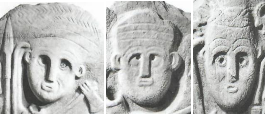
Resim 10. Hakkâri stellerinde yer alan başlıklardan örnekler

Başlık, şapka başlangıçta insanın başını soğuk, güneş gibi dış hava koşullarından korumak için kullanılmıştır. Zamanla bunların kişiler için ve toplumda farklı anlamlara büründüğü görülür. Sürekli kullanılan bir eşya olan başlık ve şapka zamanla kişinin bir parçası haline gelmiş ve kişiye göre biçimsel olarak şekillenerek anlamlar oluşturmuştur. Şapkanın biçiminden, büyüklüğüne, kullanılan malzemeye ve işlemlerine kadar kişinin toplumdaki statüsünü gösteren bir kıyafet halini almıştır. Aynı zamanda şapka bize kişinin mesleği, statüsü, kültürel ve dini yapısı hakkında da bilgi sağlar. Koruma amaçlı giyilen şapka ve başlıklar kişinin toplumdaki yerine göre kullanılan malzemeden üzerine yapılan işlemlere dokumalara kadar farklılık göstermiştir. Bir nevi kimliğin taşıyıcısı olan şapka Hakkâri stellerinde de görülür. Her bir stelde kullanılan şapka (Resim 10) boyut ve biçim olarak farklılık gösterir. Bu farklılıklar bize savaşçıların toplumdaki konumlarını algılamada yardımcı olur. Büyük ve işlemesi fazla olan şapkalı savaşçıların diğerlerine göre önem sıralamasında önde olduğu sonucuna ulaşabiliriz. Şapkalarda yer alan motiflere baktığımızda genelde birbirini tekrar eden hayatın devamlılığı ve nazarla ilişkilendirilen göz ve suyolu motiflerini görürüz.