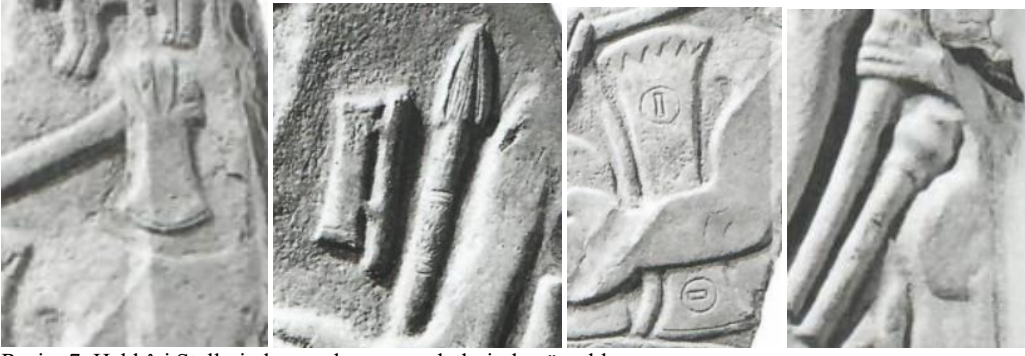
Resim 7. Hakkâri Stellerinde yer alan savaş aletlerinden örnekler