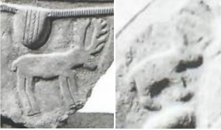
Resim 11. Hakkâri stellerinde yer alan geyiklerden örnekler