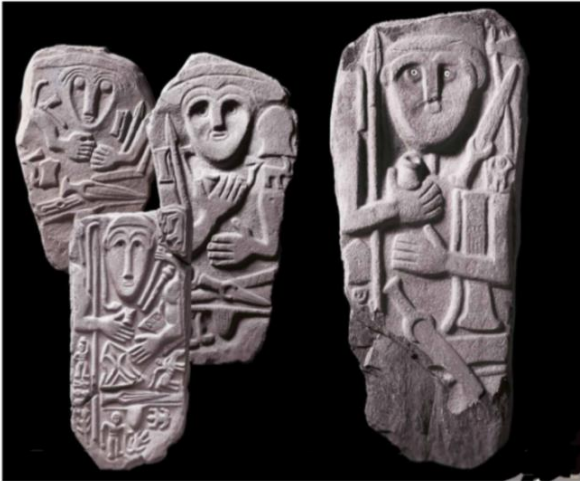
Resim 1. Hakkari Stelleri

Steller bulunulan coğrafyadaki malzemeye göre yapılmıştır. Malzemenin olanakları, işlemeye uygunluğu, sert ya da yumuşak bir yapıda oluşu betimlemenin şeklini belirlemiştir. Yontuya uygun malzemelerde daha detaylı bir biçimde işlenmiş betimlemeler, yontuya çok uygun olmayan yapısı sert olan malzemelerde ise çizgisel, detaydan uzak betimlemeler karşımıza çıkmaktadır. Hakkâri stelleri yörede bulunan farklı renklerde ve yapılardaki kireç taşından yapılmıştır. Bu taşların işlemeye uygunluğu stellerin biçimlendirilmesinde etkili olmuştur. Stellere baktığımızda 13 stelin dokuzu kabartma biçiminde dördünün ise çizgisel biçimde yapıldığı (Resim 2) görülür. Betimlemedeki bu farklılık malzemenin sertliği, işlemeye uygun olmayışı ile ya da dört figürün diğer dokuzundan daha az önemli olmasıyla ilişkilendirilebilir.