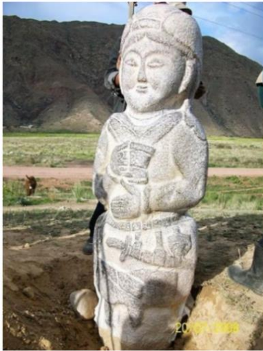
Resim 5. Eski balbal örneği

Hakkâri stellerine baktığımızda biçimsel yapısı itibariyle Türklerle olan etkileşimi ya da Türklerin bıraktığı anıt niteliğindeki mezar taşları olduğu sonucuna ulaşılabilir. Bu düşüncenin oluşmasında Hakkâri stelleri üzerinde yer alan yurt tipi çadırlar, ant kadehi, tasvir edilen kişinin yüz şekli ve Türklerin diktiği balballar ve taş heykellere benzerliği (Resim 5) büyük rol oynar. Hakkâri stellerine baktığımızda bulunan 13 stelin betimlemede kullanılan unsurlar ve betimleme biçimi bakımından birbirinden farklılık gösterdiği görülür. “Günümüze ulaşan insan biçimli Göktürk Dönemi heykelleri arasında daha gerçekçi tarzda yapılmış örneklerin yanı sıra daha soyut ve yalın yapılmış olanları da mevcuttur. Çeşitli boyut ve biçimlerde yapılan bu anıtlar genelde kült merkezleri ve mezar alanlarında yer almaktadır” (İskenderzade 2010: 258). Girilen bir savaş sonrası hem kaybedilen kişiler hem de kazanılan zaferin anıtlaştırılma çabası bu heykeller-de görülür. Göç güzergâhı üzerinde yapılarak bırakılan bu heykeller aynı zamanda sürülen izin ya da geçilen yerlerin bir haritasını oluşturur.