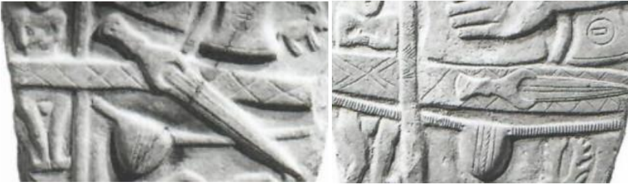
Resim 8. Hakkâri stellerinde yer alan erlik kemerinden örnekler

Erlik kemeri eski Türk kültüründe önemli bir yer edinir. Çünkü er kişi yani belirli bir fiziksel güce erişmiş ve bunu kanıtlamış olan kişidir. Roux' a göre (2011: 52) erklik "erkek", "eril" anlamına gelen er sözcüğünden oluşmaktadır. Erk "erkeklik", "kahramanlık", "güç" anlamına gelmektedir. Erklik (ya da rkl ses öbeğinin düşmesi sonucu erlik) "erkek, kahraman olma özelliğine sahip kişi" anlamına gelmektedir. Birçok Eski Türkçe metinde, erklik sözcüğü yalnızca kudretli şahsiyetleri nitelendirmek için kullanılmıştır. Erlik kemeri sembolik bir anlama sahip olması nedeniyle herkesin takabileceği bir aksesuar olmanın dışındadır. Bu sebeple hak edenin sahip olacağı bu kemerin takılması da bir törenle gerçekleştirilirdi. Hakkâri stellerinin kadın olarak betimlenenler dışında 11 i erlik kemeri ile (Resim 8) betimlenmiştir. Bu kemerlerin üzerinde kılıç ya da hançer gibi silahlar asılıdır. Hakkâri stellerinde yer alan erkeklerin erlik kemerleri ile betimlenmesi bu kişilerin hem birey olarak hem de toplum adına önemlerini göstermek için olduğu sonucuna ulaşılabilir. Bu betimlemelerden erlik kemerine olan kişilerin sahip oldukları gücün ölümle bitmeyeceği, bunu ölümden sonraki yaşamda da sürdüreceği ve kazandığı erlik ünvanını simgelediği sonucuna ulaşılır.