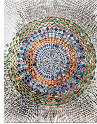
Görsel 20. Monir Farmanfarmaian "Gündoğumu", 2015, Alçı ve ahşap üzerine ayna ve ters cam boyası, 130 x 100 cm.

Leandro Erlich, fizik yasasına ve izleyicilerin gerçeklik duygusuna bir yanılısma getirmiştir. Zeminde düz duran Victoria dönemi binalarından birinin karşısına 45 derecelik bir açıyla yerleştirdiği büyük bir aynayla görüntüyü yansıtarak gerçekliği anlamada algıyı değiştirir. Aynayı sıklıkla eserlerinde kullanan İranlı sanatçı Monir Farmanfarmaian, ayna mozaikleri ve geometrik desenleri ile tanınır. Aynalı cam parçalarını sıvalı yüzeye yerleştirerek geleneksel tekniklerle eserlerinde İslami geometrik formlarla dekoratif ve soyut geometrik formları modernist bir biçimde birleştirmiştir. Geleneksel bir İran tekniği olan ayna-mozaikini yeniden yorumlayan duvar tabanlı paneller sayesinde hem ayrıntılı bir zanaat hem de yüzey dokusu, ışık ve yansıma ile renk ve biçim etkileşimini kullanan çağdaş bir soyutlama sunar. Monir'in eserindeki bu karakteristik ayna mozaik, on altıncı yüzyıla kadar uzanan bir teknik olan "ayneh-kari" olarak bilinen İran'a ait dekoratif bir şekildir.