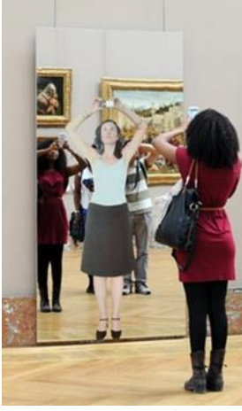
Görsel 15. Michelangelo Pistoletto “Fotoğraf Çeken Kız”,1962-2007, Parlak paslanmaz çelik üzerine serigrafik baskı, 250 x 125 cm.