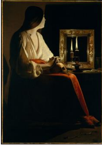
GörSEL 5. Georges de La Tour "Tövbekar Maria Magdalena", 1640. Tuval üzerine yağlıboya, 134,4 x 102,2 cm.