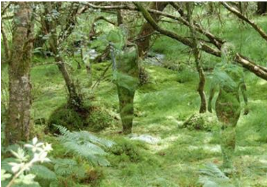
Görsel 17. Rob Mulholland “Yaşam Boyu Silüetleri”, 2009, Paslanmaz Çelik ve cilalı ayna, Vestiges Park Açık Hava Sergisi

İtalyan sanatçı Pistoletto, süreç içerisinde değişimi izlenebilir ve gözlenebilir kılan ve temel malzemesi ayna olan örnekteki gibi bir çok çalışmalar üretti. Bunlar gerçek zaman ve izleyiciyi çalışmanın içine doğrudan alan ayna resimleri serisiydi. Yansıyan yüzey ve izleyiciler aynanın içinde görüntü olarak çakıştığında espas ve bilinç iki görüntüyü de ayırabilmekteydi. Pistoletto bir seri şekilde çalıştığı aynalı çalışmaları ile zamanın boyutu, fotoğrafik görüntü, yansıtıcı yüzeyde izleyicinin sanat eserine dahil edilmesi ve yaşanan deneyimle oluşan sanal alan etkileşimi elde etmiştir. Danimarka-İzlandalı kavramsal sanatçısı Olafur Eliasson’ı dev yerleştirmeleri, optik yanılsamalarla kurguladığı eserleri ve kurgusal fotoğrafları ile tanımaktayız. Işıklar, aynalar, optik yanılsamalar ile algı, hareket ve beden deneyimini izleyiciye sunmaktadır. “Acele Etmeyin” adlı eserde tavana yerleştirilmiş dev ayna ile oda kuşbakışı yansıtılmaktadır. Aynanın eğimli hareketi mekanda algı ve denge deneyimi uyandırmaya çalıştığı söylenebilir. Dan Graham’ın Venedik bienali için yaptığı bu çalışmasında çeşitli şeffaf, yansıtıcı cam ve aynalarla birlikte izleyiciyi de çalışmaya dahil etmek hedeflenmiştir. Böylece çalışmalarında deneysel gözlemler oluşturmuştur.