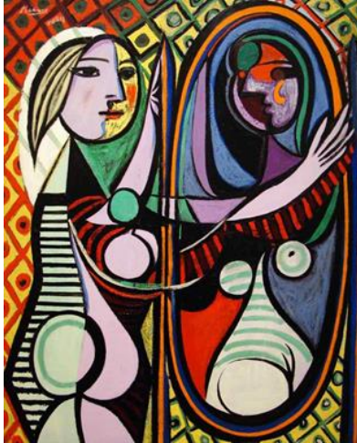
GörSEL 7. Pablo Picasso "Aynanın Önündeki Kız", 1932. Tuval üzerine yağlıboya, 162,3 x 130,2 cm. Tuval üzerine yağlıboya, 162,3 x 130,2 cm. Modern Sanatlar Müzesi, New York

Sıcak kırmızılar, kahverengilerle mistik etkiler yaratan mum ışığında aydınlatılmış dini sahneleri resmeden Georges de La Tour, resimdeki kafatası ile ölümü, resimde ışığı yansıtan ayna ile de kibri ve dünyevi olaylara duyulan kaygıyı meditasyon hissi uyandıran bir sahneyle betimlemiştir. Batı sanatında yapay ışık kaynağını aynayla yansıtmının ilk örnek olduğu kuşkusuz söylenebilir. Velazquez'in çalışmasına geldiğimizde ise Tanrıça Venüs'ü erotik bir pozda betimlemiş görürüz. Venüs, Roma mitolojisinde aşk tanrısı olan Cupido'nun tuttuğu aynadan kendini izlemektedir. Velazquez, Venüs'ün çok bilinen iki pozunu birleştirmiştir. "Koltuk ya da yatak üzerinde uzanma" ve "aynadaki yansımasını izleme". Ressamın, aynayı merkeze yerleştirmesi ve aynadan Venüs'ün izleyicinin ilk etapta görmediği yüzünü yansıtmaması resim sanatı açısından o güne kadar görülmemiş farklılıklardır. Üç boyutluluğu ve canlılığıyla bir bakışta insanı kuşkusuz etkileyen çağının en cüretkar resimlerinden biridir ve hem göze hem ruha hem de duygulara hitap eden etkileyici bir baş yapıttır. Bu iki resimdeki ayna farklı kullanımlarıyla sanat tarihinde önemli örnekler arasında yer alır.