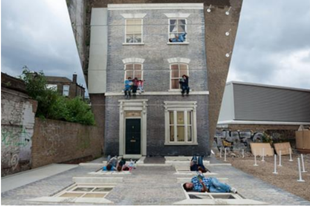
Görsel 19. Leandro Erlich "Leandro Erlich", "Victoria dönemi binalardan birinin 45 derecelik açıyla yansıtılmış bir cephesi" Londra, 2013

karşısına oturan kişi kendine sıradan bir şekilde bakarken, yüzünün gerçekteki görünümünü değişip yerine aynanın arkasına yerleştirilmiş video projektör ile farklı bir imge belirmesiyle yanılısma oluşması amaçlanan bir çalışmadır. Günümüzde yeni medya eserinde kullanılan bu tarz işlere sıkça rastlanmaktadır.