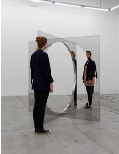
Görsel 9. Jeppe Hein “Boyutlu Daire”, 1937. Cilalı paslanmaz çelik ve alüminyum, 200 x 200 x 200 cm.

Disiplinlerarası bir yaklaşımla çağdaş sanatın, yeni ve alternatifini oluşturan malzeme arayışında sanatçılar teknolojiden de yararlanıp ayna ve özelliğinden yola çıkarak bugüne kadar kullanılmamış şekilde sanat eserleri ortaya koymuşlardır. Enstalasyon, heykel ve hatta mimaride de aynanın sanatta farklı yansımalarını görmekteyiz. Aynanın resmini yapan eski dönem sanatçıların aksine günümüz sanatçıları, parlak yüzeye sahip tüm nesnelere ayna olarak kabul edip evrene ve yaşama dair düşüncelerini görsel dille biçimlendirmede hazır nesne olarak kullanmışlardır. Yani ayna, sanat yapmada kullanılan bir tür materyal özelliğine kavuşmuştur. Lucas Samara'nın, Anish Kapoor'un, Yayoi Kusama'nın vb sanatçıların kendi sanatsal usullerine uygun hale getirilmiş önemli bir sanat nesnesi konuma dönüşmüştür.