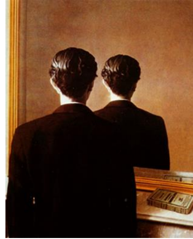
GörSEL 8. Rene Magritte "Çoğaltılması Yasaktır", 1937. Boijmans Van Beuningen Müzesi

Genç Marie-Therese'in bir ayna önündeki bu resmini Picasso, önemli bir çalışma olarak diğerlerinden ayrı tutmuştur. Ustaca bir karşılaşma ile ressam genç kadının yandan görünümünü ve aynadaki yansımasını gösterir: Yan görünümdeki çok katmanlı küçük renk alanlarının aksine aynadaki görüntü, hareketli konturlarla ve büyük tek renkli alanlarla çevrelenir (Buchholz,2005;58). Dikkate değer bir özelliği ise, aynadaki görüntünün Marie Therese'den daha çirkin ve daha yaşlı görünmesidir. Picasso'nun resimlerinde pek de alışık olmadığımız bu dışavurumcu etki genç sevgilisinin iç dünyasının karamsarlığını bizlere yansıtır. Bir bakıma ayna, dış görüntüye değil iç görüntüyü yansıtmıştır. Böylece görüntünün yansıması ayna yardımıyla zenginleştirilmiştir. Magritte, resmindeki sırtı dönük olan kişinin aynada yüzünü göstermek yerine sırttan gerçeküstü bir şekilde yansıtmıştır. Tıpkı Picasso'da olduğu gibi yansıyan