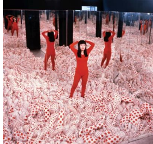
Görsel 10. Yayoi Kusama “Sonsuzluk Aynalı Oda”, 1965. Floor Show'da, Castellane Gallery, New York, Doldurulmuş pamuklu kumaş, tahta ve aynalar.