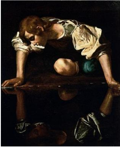
Görsel 1. Michelangelo Merisi da Caravaggio, “Narcissus” 1597-1599, Tuval üzerine yağlıboya, 110 x 92 cm. Roma Ulusal Antik Sanatlar Müzesi.

“Çobanların sürülerini getirmedeği, keçilerin uğramadığı, orman sakinlerinin kullanmadığı ve gümüş gibi berrak sularına yaprak dahi düşmeyen, etrafı yemyeşil otlarla kaplı, kayaların gölgesinde gizlenen bir pınar vardı. Bir gün gencin yolu avdan dönerken buraya düştü, çok yorgundu, susamıştı. Pınarın berrak sularından içmek için eğildiğinde yüzeyinde kendi yansımısını gördü, ancak gördüğünün suyun içinde yaşayan güzel bir peri olduğunu düşündü. Onun parlak gözlerine, Bacchus ya da Apollon'un kilere benzeyen buklelerine, yuvarlak yanaklarına, fildişine benzeyen boyuna, hafifçe aralanmış dudaklarına ve sağlıklı, zindelik taşan bedenine hayranlıkla baktı. Kendisine aşık olmuştu. Yaklaşıp onu öpmek, bu muhteşem varlığa sarılmak istedi, kollarını suya daldırdı, o anda görüntü kayboldu, ancak bir an sonra tüm cazibesıyla yeniden belirdi. Pınarın kıyısından kalkamıyor, gözlerini kendi görüntüsünden alamıyordu. Artık ne dinleniyor, ne yemek yiyordu, sürekli onu düşünür olmuştu” (Bulfinch,2015;94-95).