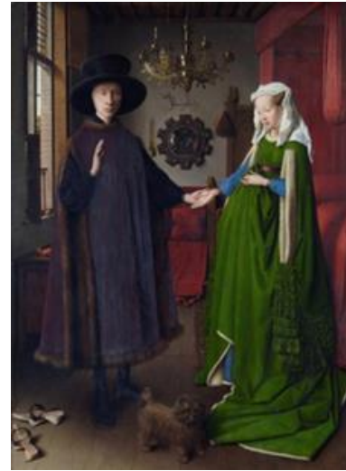
Görsel 2. Jan van Eyck, “Arnolfini'nin Evliliği”, 1434, Meşe üzerine yağlıboya, 60 x 82 cm. Londra Ulusal Galeri

Giovanni Arnolfini ve eşi Jeanne de Chenany'in betimlendiği Jan van Eyck'in resminde figürlerin verdikleri pozları ve resimdeki detaylar nedeniyle çiftin nişan ya da evlilik törenlerini belgelemek üzere yapıldığı düşünülmektedir. Resimdeki küçük detaylar sanatçının teknik ustalığını ve konunun derinlemesine işlendiğini göstermektedir. Duvarda dış bükey ayna tasviri bulunmaktadır. Aynadan çift ve ayakta duran iki kişi görülmektedir. Ayrıca resimdeki ayna sadece ressamın şahitliğinin değil, aynı zamanda Tanrının şahitliğinin de sembolüdür. Dış bükey ayna resmin neredeyse merkezinde, odak noktası durumunda olmasına karşın görüntü oradan dışarı doğru açılmakta yani sahneyi ters bir biçimde yansıtmaktadır.