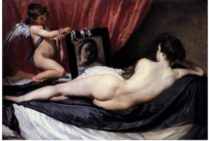
GörSEL 6. Diego Velazquez "Aynadaki Venüs", 1647-51. Tuval üzerine yağlıboya, 122,5 x 177 cm. Ulusal Galerî- Londra

Sıcak kırmızılar, kahverengilerle mistik etkiler yaratan mum ışığında aydınlatılmış dini sahneleri resmeden Georges de La Tour, resimdeki kafatası ile ölümü, resimde ışığı yansıtan ayna ile de kibri ve dünyevi olaylara duyulan kaygıyı meditasyon hissi uyandıran bir sahneyle betimlemiştir. Batı sanatında yapay ışık kaynağını aynayla yansıtmının ilk örnek olduğu kuşkusuz söylenebilir. Velazquez'in çalışmasına geldiğimizde ise Tanrıça Venüs'ü erotik bir pozda betimlemiş görürüz. Venüs, Roma mitolojisinde aşk tanrısı olan Cupido'nun tuttuğu aynadan kendini izlemektedir. Velazquez, Venüs'ün çok bilinen iki pozunu birleştirmiştir. "Koltuk ya da yatak üzerinde uzanma" ve "aynadaki yansımasını izleme". Ressamın, aynayı merkeze yerleştirmesi ve aynadan Venüs'ün izleyicinin ilk etapta görmediği yüzünü yansıtmaması resim sanatı açısından o güne kadar görülmemiş farklılıklardır. Üç boyutluluğu ve canlılığıyla bir bakışta insanı kuşkusuz etkileyen çağının en cüretkar resimlerinden biridir ve hem göze hem ruha hem de duygulara hitap eden etkileyici bir baş yapıttır. Bu iki resimdeki ayna farklı kullanımlarıyla sanat tarihinde önemli örnekler arasında yer alır.