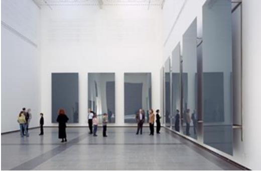
Görsel 13. Gerhard Richter “Sekiz Gri”, 2002, her biri 500 x 270 cm. emane gri cam ve çelik, Deutsche Guggenheim, Berlin

Samaras’ın tepeden aşağıya aynalarla kaplanmış olan “Halkla Aynalı Oda” adlı çalışmasıyla izleyici yeni ve farklı deneyimlere doğru yola çıkarır. İzleyiciye; sonsuzluk, yansıma, kırılma, sınırsızlık, zamansızlık, mekansızlık gibi kavramlarla gerçeküstü bir deneyim yaşatır. Dan Graham ise şeffaf ve yansıtıcı olan iki yönlü aynalar ile izleyicinin esere dahil olup ya da eserden ayrılmasıyla değişen görünüm oluşturmuştur. Böylece çalışmalarının deneysel etkileri kendiliğinden gelişmiştir.