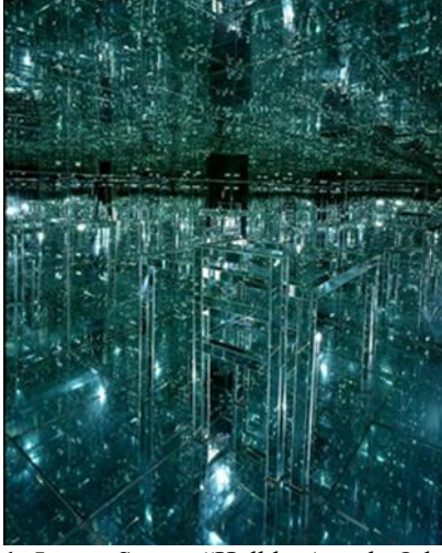
Görsel 11. Lucas Samar “Halkla Aynalı Oda”, 1966, Ahşap kurulumdaki ayna 243,8 x 243,8 x 304,8 cm. Albright Knox Sanat Galerisi

“Aynalarla çevrelenmiş odalar, içinde bulunan her objenin ve aynaların sonsuz sayıda yansımından oluşturuyor. Ziyaretçiler beş odanın içine teker teker alınarak kendilerini sonsuzluğun içinde görebiliyorlar, altıncı odaya ise küçük bir pencereden bakabiliyorlar. Bütün yüzeylerin aynalarla çevrelendiği odalara girdiğinizde kapı arkanızdan kapanıyor ve benzersiz bir deneyimle baş başa kalıyorsunuz” (Çelebi, 2017).