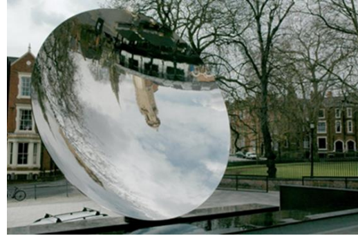
Görsel 14. Anish Kapoor “Gök Ayna”, 2006, Paslanmaz Çelik 10 tonluk ve 6 m. genişliğinde içbükey ayna, Nottingham

Günümüzün önemli sanatçıları arasındaki Alman sanatçı Gerhard Richter, dijital fotoğraflar, hiperrealist çalışmalar, soyut işler, cam yerleştirmeler, ayna işleri gibi çok çeşitli teknikler ve malzemelerle eserler üreten bir sanatçıdır. “Sekiz Gri” adlı çalışması sekiz anıtsal gri emaye cam plakasından oluşur ve duvara çelik krişlerle monte edilmiştir. Denge unsuru olan gri ile bir nötrleştirme sağlamıştır. Bu işler resim, heykel ve mimari arasında belirsiz bir kategoride bulunmaktadır. Mekanı bulanık yansıtan özellikleriyle de bir illüzyon, düşsel yansıma halüsinasyon içermektedir. Hint asıllı İngiliz vatandaşı Anish Kapoor’un “Gök Ayna” adlı eserinde hava unsuru ve zaman unsuruyla ayna yüzeyindeki görüntünün sürekli devir daim içinde olması nedeniyle eser bu unsurlarla sürekli dönüşüm ve değişim içindedir. Meral Sayar, Kapoor’un “Gök Ayna” adlı eserini şu şekilde yorumlar: