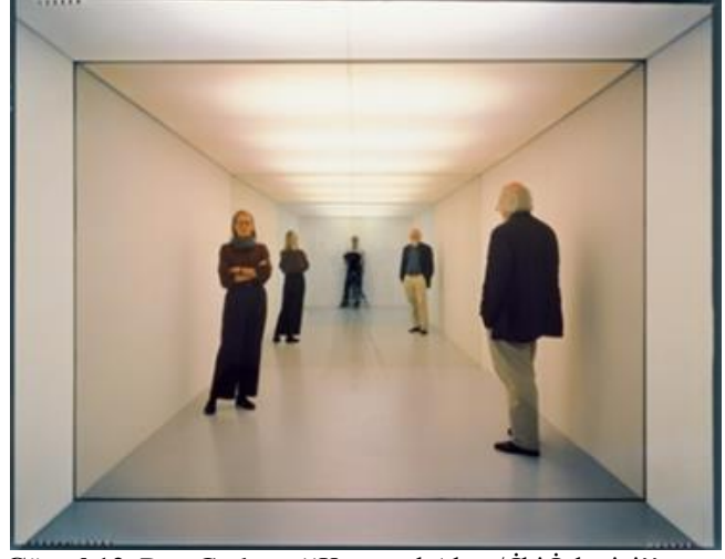
Görsel 12. Dan Graham “Kamusal Alan / İki İzleyici”, 1976.

Samaras’ın tepeden aşağıya aynalarla kaplanmış olan “Halkla Aynalı Oda” adlı çalışmasıyla izleyici yeni ve farklı deneyimlere doğru yola çıkarır. İzleyiciye; sonsuzluk, yansıma, kırılma, sınırsızlık, zamansızlık, mekansızlık gibi kavramlarla gerçeküstü bir deneyim yaşatır. Dan Graham ise şeffaf ve yansıtıcı olan iki yönlü aynalar ile izleyicinin esere dahil olup ya da eserden ayrılmasıyla değişen görünüm oluşturmuştur. Böylece çalışmalarının deneysel etkileri kendiliğinden gelişmiştir.