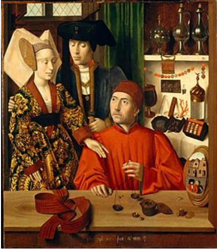
Görsel 3. Petrus Christus “St. Eligius İşyerinde”, 1449, Ahşap üzerine yağlıboya, 98 x 85.2 cm. Metropolitan Müzesi, New York

15. ve 16. yüzyıl Flaman resminde aynaya çeşitli sembolik anlamlar yüklenmiş, ayna neredeyse geleneksel bir öğe olarak yapıtlarda yer almıştır. Flaman okullarında aynanın geleneksel olarak yer almasını başlatan yapıt ise Jan Van Eyck'ın "Arnolfini'nin Evliliği" isimli resmi olmuştur. Eyck'ın gerçeklik ve yoğun sembolizm ile kutsal kabul edilen bir anı (evlilik) benzeri görülmemiş bir ustalıkla betimlemesi Flaman geleneğinin bir unsurudur.