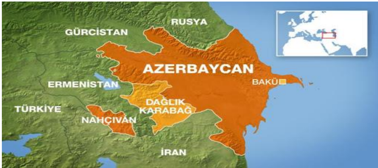
Harita 1. Azerbaycan'ın Karabağ'ı kurtarması sonucu oluşan Nahçıvan bağlantı yolu

Aşağıda belirtilen haritada Azerbaycan'ın öz toprağı olan Dağlık Karabağ bölgesinin ele geçirilmesi ile ekslavı olan Nahçıvan Özerk Cumhuriyeti'ne karayolu ile bağlanmıştır. Bu bağlantı yolu stratejik açıdan büyük önem arz etmektedir. Türkiye ile 17 km'lik bir sınır hattına sahip olan Azerbaycan ekslavı Nahçıvan'ın, Azerbaycan ile karayolu vasıtasıyla bağlanması sonucu Türkiye Azerbaycan arasında doğrudan bir bağlantı yoluna da sahip olunmaktadır.