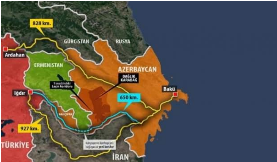
Harita 2. Türkiye-Azerbaycan alternatif karayolu güzergahları ve km'leri

Karabağ'ın işgalden kurtarılması ile yeniden şekillenen bölgede eksiltilen ülke Nahçıvan vasıtasıyla Azerbaycan ile Türkiye sınır komşusu konumuna gelmiştir. Diğer bir deyişle Türkiye ile Azerbaycan arasında tarımdan turizme, eğitimden sağlığa ve madencilikten enerji sektörüne vb. gibi birçok alanda işbirliği yapılmasının ve halihazırda var olan işbirliklerinin genişletilmesinin önünü açmıştır. Bu durum sadece ticari açıdan değil aynı zamanda dış politika açısından iki ülkeye çeşitli kazanımlar sağlamıştır. Bu durumun en net örneği Rusya'nın Çarlık ve Sovyet dönemleri de dahil olmak üzere uluslararası alanda uygulamış olduğu Türkiye'yi Orta Asya ve Kafkasya'dan koparma stratejisi bu koridor vasıtasıyla sekteye uğramıştır. Türkiye bu koridor sayesinde Kafkasya ile Orta Asya'nın zengin enerji yataklarına kesintisiz bir şekilde bağlanmış ve politik anlamda elini daha da güçlendirmiştir. Bu durum Orta Asya ve Kafkasya üzerinde Türkiye için ticari ve politik açıdan yeni bir dönemin başlangıcı anlamına gelmektedir. Azerbaycan tarafı ise Nahçıvan üzerinden geçecek koridor vasıtasıyla başta Türkiye olmak üzere Avrupa'ya kolaylıkla açılacaktır.