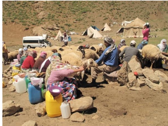
Resim-5. Zoma (Yayla) yaşantısı, Bayköyü yaylası

Yörede yapılan karşılıklı görüşmelerde parzun dokumaların atkısında ve çözgüsünde, yörede elde edilen yünden yapılan ipliklerin ve keçi kılının kullanılmış olduğu belirlenmiştir. Yakın tarihte yapılan dokumalarda ise hazır ip kullanılmaktadır. Yörede yaşayan halk haziran, temmuz ve eylül aylarında zomaya (yaylaya) çıktığında kendilerinin belirlemiş oldukları yerlere keçi kılından kendi dokudukları kıl çadırlarını kurarlar (Bakınız, Resim-5).