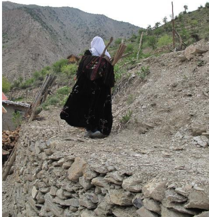
Resim-3. Parzun örneği, Kırıkdağ Köyü, 2018