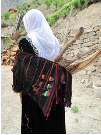
Resim-1. Parzun örneği, Kırıkdağ Köyü, 2018

Bu ürünler arasında yörede sıkça kullanılan “Parzun” denilen dokumada yer almaktadır. Parzun süt tulumu taşımada, yaylada çalı çırpı taşımada ve sırtta bebek taşımada kadar taşınabilecek küçük ve yükte az ağır olan eşyaları içine koyarak iki ucunda yılan tekniği veya ayak ve el yardımı ile ince uzun örülen ip şeklindeki dokumalar ile sırtta bağlanmakta ya da çuval gibi taşınmaktadır (Öztürk, 2013: s.142), (Bakınız, Resim-1, 2, 3, 4).