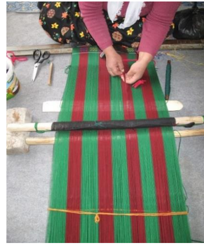
Resim-12. Dokuma işlemi

(Fotoğraf: Öztürk, G., Vesile Turan'ın evi, Kırıkdağ Köyü, 2017)