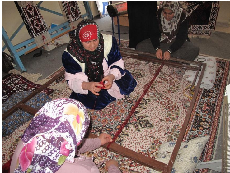
Resim-8. Metal germe tezgâhı, (Fotoğraf: Öztürk, İ. 2015, Hakkâri)

Parzun dokumaları eski dönemlerde yer tezgahında dokunmaktaydı. Yer tezgahının yöresel adına “teveni” yere çakılan kazık ya da ağaç parçalarına ise “sin” adı verilmektedir (Akdoğan, Sözlü görüşme, 2018). Günümüzde ise parzun dokuması yapımında metal germe tezgâh yere yatırılıp aynı yer tezgâhı sisteminde kullanılmaktadır (Bakınız, Resim-8).