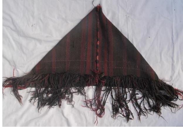
Resim-17. Parzun örneği, Bulak Mah. Hakkâri, 2017

Parzun örneği Hakkâri il merkezi, Bulak mahallesinde tespit edilmiştir. Dokumanın ebatları 80x42 cm. saçak uzunluğu ise 25 cm.'dir. Dikdörtgen formda dokunan parzun iki köşesinde ortaya eşit şekilde getirilerek birleştirilip dikilmiştir. Dikildikten sonra üçgen formuna dönen dokumanın zemini birbirini dikine tekrar eden şeritler ile hareketlendirilmiştir. Zeminin tamamı bu şeritlerden oluşmaktadır. Zemin (çözgü) ipi rengi olarak siyah, kahverengi ve kırmızı, atkı ipi olarak siyah renk kullanılmıştır. Dokuma sade bir görünüme sahiptir. Saçakları örülmüştür (Bakınız, Resim-17).