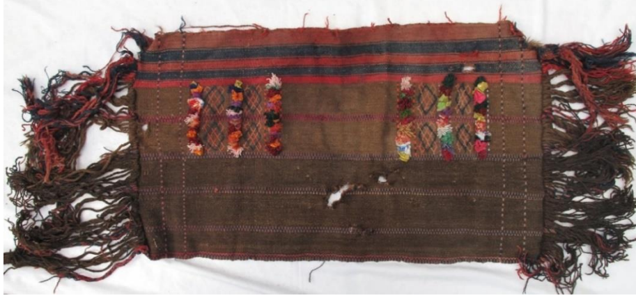
Resim-16. Parzun örneği, Yeni Mah. Hakkâri, 2017

Dokumanın sağ ve sol kenarında kuşakların içi karelere bölünmüş ve içlerine sumak tekniği ile yapılmış geometrik motifler ve ilme tekniği kullanılarak oluşturulan gulfikler ile düzenlenmiştir. Saçak kısmı ve orta zemin yıpranmıştır (Bakınız, Resim-16).