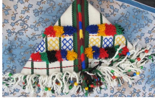
Resim-13. Çeyiz ve süs amaçlı dokunmuş parzun örneği, Kırıkdağ Köyü, 2017

Her iki ucuna birer tane kolun ya da kolluk örülerek kullanan kişinin sırtına üçgen biçimi gelecek şekilde arkadan omuzlara omuzlardan ön tarafa sarkan kolluklar ile takılır ya da bağlanır (sırta alınan bir çuval gibi). Bu kolluklar insanın her iki kolu uzunluğunda örülmektedir. Ya da kolan dokuma yapılarak sağ ve sol uç kısmına dikilerek aynı şekilde sırta bağlanır. Parzun dokumasında yün ipleri oldukça sıkı bir şekilde düz ve bezayağı tekniği ile dokunmuştur. Zemini süslemede cicim, sumak ve ilme dokuma teknikleri kullanılmıştır.