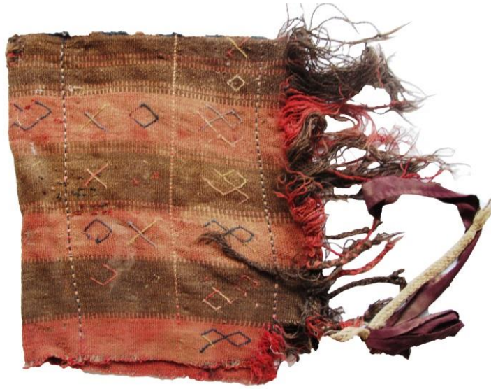
Resim-20. Parzun örneği, Bağışlı Köyü, 2017