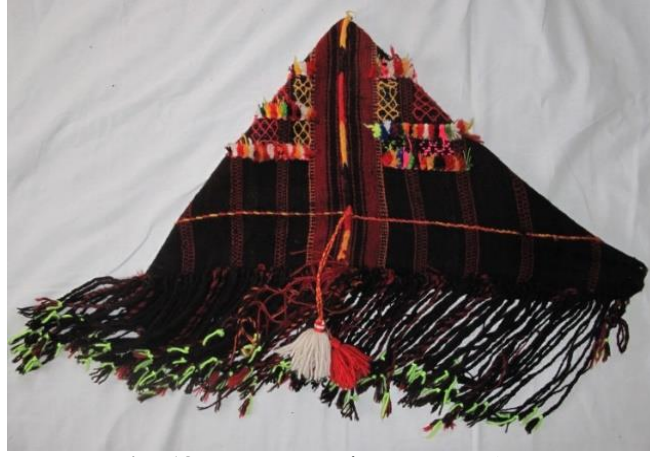
Resim-18. Parzun örneği, Merzan Mah. 2017

Parzun örneği Hakkâri il merkezine bağlı bulunan Üzümcü köyünde tespit edilmiştir. Dokumanın ebatları 80x40 cm. saçak uzunluğu ise 40 cm.'dir. Dikdörtgen formda dokunan parzun iki köşesinde ortaya eşit şekilde getirilerek birleştirilip dikilmiştir. Dokuyucu genç yaşında dokumuş olduğu parzun dokuma örneğini; odun, süt, un, buğday, ceviz gibi yiyecekleri ve bahçede yetiştirmiş oldukları sebze ve meyveleri taşımak için kullanmışlardır. Dokuma dikildikten sonra üçgen forma dönüşmüş olup bu şekilde kullanılmıştır. Dokumanın oluşan enine ve boyuna birbirini kesen dikdörtgen formlu kompozisyon ile desenlendirilmiştir. Oldukça eski olan dokumada zemin rengi kırmızı, kahverengi ve beyaz atkı ipi olarak siyah renk kullanılmıştır. Sade bir görünüme sahip olan dokumanın saçakları örülmüştür (Bakınız, Resim-18).