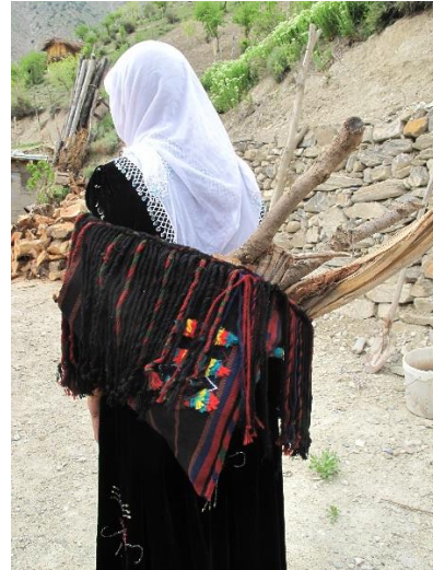
Resim-4. Parzun örneği detay, Kırıkdağ Köyü, 2018