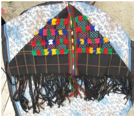
Resim-14. Parzun örneği, Kırıkdağ köyü, 2017

Parzun örneği Hakkâri il merkezine bağlı bulunan Kırıkdağ köyünde tespit edilmiştir. Dokumanın ebatları 80x40 cm. saçak uzunluğu ise 25cm.'dir. Dikdörtgen formda dokunan parzun iki köşesinde ortaya eşit şekilde getirilerek dikilmiştir. Katlandığında kare, açıldığında ise üçgen formdadır. Parzunun zemini dikine birbirine paralel ve tekrar eden kuşaklardan meydana gelmektedir. Zemin (çözgü) ipi rengi olarak siyah, yeşil, kırmızı ve kahverengi, ilave desen ipi olarak mavi, pembe gulfik süslemesi içi mavi, sarı, kırmızı pembe ve yeşil renkler kullanılmıştır. Zeminin tamamında bu kuşaklar yer alır. Dokumanın sağ ve sol kenarında kuşakların içi karelere bölünmüş ve içlerine sumak tekniği ile yapılmış geometrik motifler ve ilme tekniği kullanılarak oluşturulan gulfikler ile düzenlenmiştir. Saçakları örülmüştür (Bakınız, Resim-6,7).