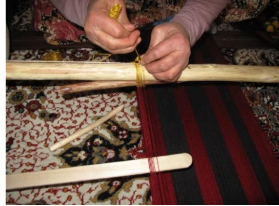
Resim-10. Sarma gücü örgüsü işlemi, Kıran Mah.