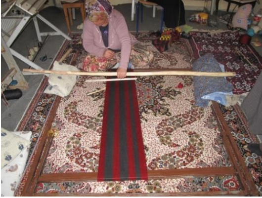
Resim-9. Çözgü işlemi, Kıran Mah.

Tevni tezgâhı üzerine çözgü çözme işlemi üç kişi tarafından yapılmaktadır. Çözgüler istenilen en ve boy ölçüsüne göre birbirine paralel şekilde tezgâh üzerine sıralanarak atılmaktadır. Bu işlem esnasından iki kişi leventlerin başında, bir kişi ise çözgü ipini arada getirip götürülmesiyle yapılmaktadır. Çözgü ipleri tek renk olduğu gibi iki renkli ip olarak da kullanılmaktadır (Bakınız, Resim-9). Çözgü çözme işlemi bittikten sonra sarma gücü örgüsü örülür (Bakınız, Resim-10) ve parzun dokuma işlemine başlanılmaktadır.