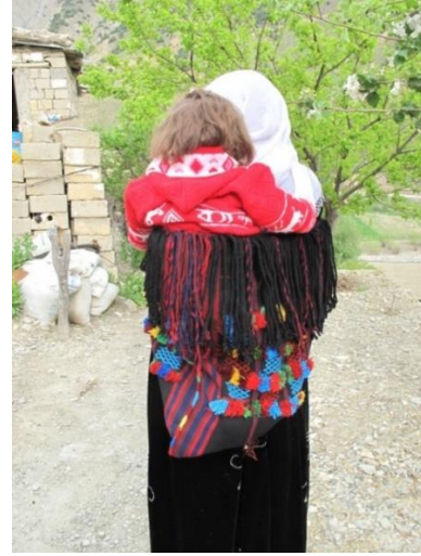
Resim-2. Parzun örneği, Kırıkdağ Köyü, 2018