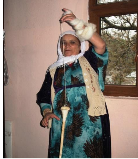
Resim-7. Teşi ile yün ipi eğirme işlemi, 2015