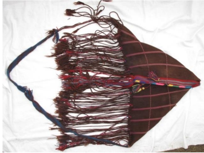
Resim-19. Parzun örneği, Üzümcü Köyü, 2017

Parzun örneği Hakkâri il merkezine bağlı bulunan Üzümcü köyünde tespit edilmiştir. Dokumanın ebatları 80x40 cm. saçak uzunluğu ise 40 cm.'dir. Dikdörtgen formda dokunan parzun iki köşesinde ortaya eşit şekilde getirilerek birleştirilip dikilmiştir. Dokuyucu genç yaşında dokumuş olduğu parzun dokuma örneğini; odun, süt, un, buğday, ceviz gibi yiyecekleri ve bahçede yetiştirmiş oldukları sebze ve meyveleri taşımak için kullanmışlardır. Dokuma dikildikten sonra üçgen forma dönüşmüş olup bu şekilde kullanılmıştır. Dokumanın oluşan enine ve boyuna birbirini kesen dikdörtgen formlu kompozisyon ile desenlendirilmiştir. Oldukça eski olan dokumada zemin rengi kırmızı, kahverengi ve beyaz atkı ipi olarak siyah renk kullanılmıştır. Sade bir görünüme sahip olan dokumanın saçakları örülmüştür (Bakınız, Resim-18).