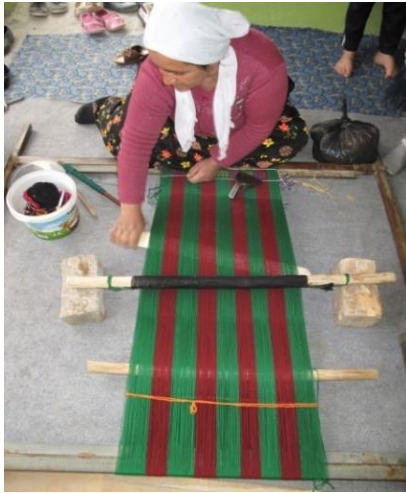
Resim-11. Dokuma işlemi

Yörede parzun dokuma başlamadan önce ilk olarak sarma çiti örgüsü atılır. Daha sonra atkı ve çözgü iplikleri birbirinin arasından geçirilerek tevni ya da metal germe tezgâhta dokuma yapılmaya başlanılır (Bakınız, Resim-11, 12). Parzun dokumalarının en genişliği yaklaşık 40cm. ile 60 cm. boy uzunluğu ise dokuyucunun isteğine göre değişmektedir.