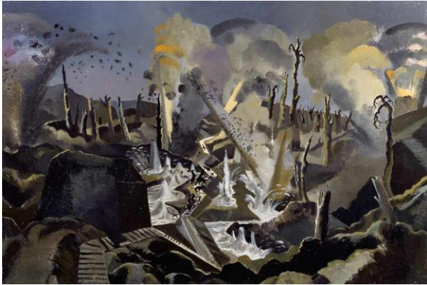
Görsel 3: Paul Nash, “The Mule Track” (Katır Yolu), Tuval Üzerine Yağlı Boya, 60,9 x 91,4 cm, 1918, Imperial War Museum.

Nash’ in 1918 tarihli “We Are Making a New World” (Yeni Bir Dünya Kuruyoruz) isimli çalışması savaşın şiddetini çarpıcı bir şekilde yansıtmaktadır (Görsel 2). Resimde yanmış, parçalanmış ağaçlar ve tepelerin ardında doğan bir güneş resmedilmiştir. Güneş sembolik olarak yeni doğan gün ve başlangıç gibi anlamlara gönderme yapmaktadır. Savaşın yıkıcı etkisini kendinden yaklaşık yüz yıl önce yapılan manzara resimlerinden farklı olarak harap olmuş bir betimleme ile ifade eden sanatçı, Hampshire Alayı’nda teğmen rütbesi ile görev yaptığı için savaşı yaşayan ve gören bir tanık niteliğindedir (Morley, 2023). Sanat tarihinde yanlış yorumlama ve farklı bakış açıları ile gerçek saptırılabilir. Örneğin Baynes’e (2016) göre, Nash’in bu resmi barışçıl, düzenli tepelerin olduğu dingin bir resim olarak nitelendirilir ve gerçek fotoğraflarla karşılaştırıldığında ise kendi duyarlılığı ve olumlamasının bir sonucu olarak görülür. Oysa sanatçı bu resmi Baynes’in yorumundan oldukça farklı bir anlamla üretmiştir. Resmin ismi savaşın yıkıcı etkilerini olumlar gibi görünüyorsa da burada bir ironi söz konusudur ve resim aslında savaşı eleştirme amacı taşımaktadır.