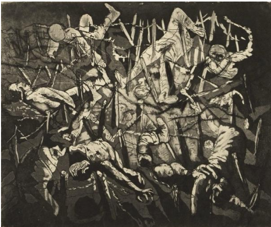
Görsel 5: Otto Dix, "Dance of Death 1917" (Ölüm Dansı 1917), Gravür, 24.5 x 29.5 cm, 1924. The Museum of Modern Art.

Almanya'nın Gera şehrinde doğan Otto Dix, 16. yüzyıl Alman sanatçılarından Hans Baldung, Matthias Grünewald, Albrecht Dürer, Lucas Cranach'ın izinden gitmiş, gravür, yağlı boya ve desenleri ile bilinen bir sanatçıdır (Lynton, 2009; Löffler, 1899; Tate, t.y.). Dix I. Dünya Savaşı'na katılarak cephede aktif olarak makineli tüfek kullanmış, savaştan sağ kurtulmuş, yaşadıklarının etkisinde resimlerini yapmış ve öne çıkan sayılı Alman savaş sanatçıları arasına girmiştir (Kurschinski at.al, 2015; Otto-dix.de, t.y.). Dix'in resimlerinde yıkım ve şiddetin etkisini yaratan üst üste toplanmış yaralılar, ölümler, savaşta kullanılan malzemeler gibi nesne ve figürlerin oluşturduğu yığıntılar/yığılmalar görülmektedir. Bu yığıntılar arasında kollar, bacaklar ve kafa gibi insan uzuvları, gergin, kasılmış, acının ve şiddetin simgeleri haline gelmiştir. Dix'in savaş sahnelerini bu denli travmatik ve kaos içinde resmetmesinin nedeni 1930 yılına kadar I. Dünya Savaşı'nda gönüllü olarak askerlik yapmış olmasıdır (Farthing ve Doğanay, 2007). I. Dünya Savaşı'nda askerlik yaptıktan sonra sakin bir hayat sürmeyi tercih eden Dix, Nazi Partisi'nin yükselmesi ile "yozlaşmış" olarak nitelendirilmiş, eserlerine el konulmuş ve bazı eserleri yok edilmiştir (Thompson, 2014). Dix'in eserlerine el konulması ve yok edilmesi nedeni ile günümüze az sayıda eserin ulaştığı bilinmektedir.