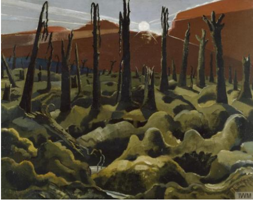
Görsel 2: Paul Nash, “We Are Making a New World” (Yeni Bir Dünya Kuruyoruz), Tuval Üzerine Yağlı Boya, 71,1 x 91,4 cm, 1918. Imperial War Museum.