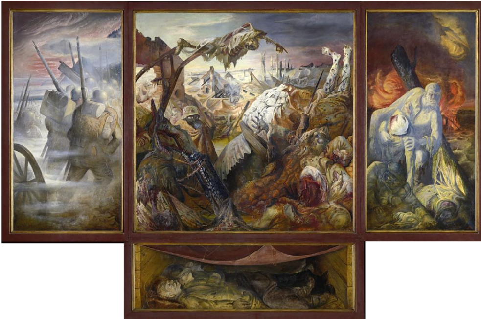
Görsel 6: Otto Dix, “The War” (Savaş), Üç Parçalı Tablo, Ağaç Üzerine Yağlı Boya ve Tempera, 112 x 204 cm, 1929-32, Galerie Neue Meister, Dresden.

vuran ışık olduğu söylenebilir. Resim durağanlığı ile bir fotoğraf gibi donuk ve ölüm kadar da gerçek görünmektedir. Askerlerin içinde buldukları ortamın savaş sırasında üzerine düşerek yakalandıkları, dikenli tellerden oluşan bir tuzak olduğu da söylenebilir.