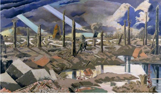
Görsel 4: Paul Nash, "The Menin Road" (Menin Yolu), Tuval Üzerine Yağlı Boya, 182.8 x 317.5 cm, 1919.