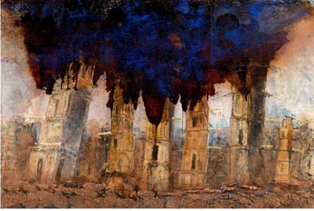
Görsel 7: Anselm Kiefer, “An Intimation of Apocalypse” (Kıyametin Bir İşareti), 2016. White Cube.