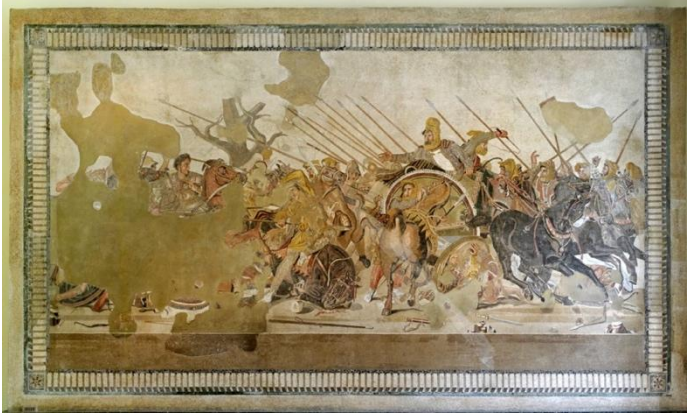
Görsel 1: Apelles, “İskender Mozaïği” (İssos Muharebesi Mozaïği), 272 x 513 cm, MÖ 120-100.

savaşlar, zaferler ve ölümler farklı dönemlerde farklı sanatçılar tarafından konu olarak seçilmiştir. İlk çağ, orta çağ ve rönesans döneminde zafer sahnelerine konu olan birçok resim, duvar resmi ve mozaikler yapılmıştır. Savaş sahneleri, savaş anıtları, zafer takları, övgü ve başarının bir ödülü olarak önemli askerler, imparatorlar ya da devlet adamları için yapılmış ya da yaptırılmıştır.