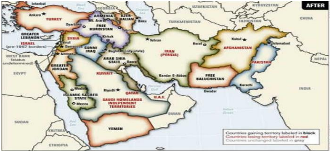
Şekil 3: BOP (Mazhar, Javaid, Goraya, 2012: 120).

ABD, planını sürdürebilmek için İran coğrafyasını kuşatma ve aynı zamanda ekonomik yaptırımlarla güçsüzleştirme amacını güdüp bir yandan da etnik-mezhebi yapıyı hareketlendirmek istemektedir. Bu bağlamda öncelikli hedefi İran'ın doğusunda bulunan ve en önemli etnik unsurlardan biri olan Beluçlardır. Bölgede İran ordusuna yönelen silahlı saldırı eylemleri ve ekonomik yaptırımlar İran odaklı ABD'nin habercisi olmuştur (Atabay, 2019).