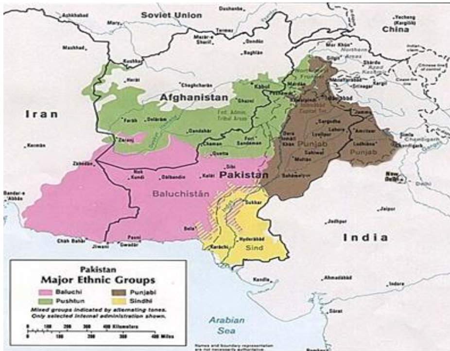
Şekil 1: Belucistan haritası (Revolv, 2019).