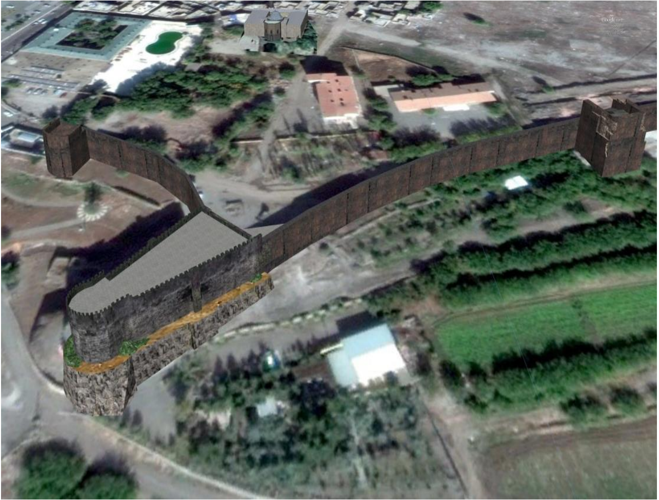
Foto: 2 Keçi Burcu'nun 3 D görünümü Google earth 2016