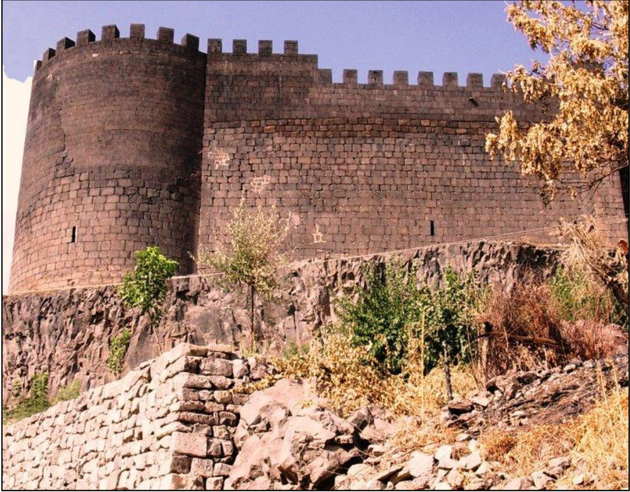
Foto: 1. Diyarbakır Surlarının en çok bilinen ve ziyaret edilen burcu olan Keçi Burcu.

Diyarbakır şehrinin sembolü olan surlar ilk defa MÖ.3.000-4.000 yıllarında Huriler tarafından bugünkü İçkale'nin olduğu yerde yapılmıştır (Harita ?). İç kalede yapılan ilk surlardan bu güne temel kalıntıları olabilecek kalıntılar kalmıştır. Günümüzde var olan sur duvarları MS.346 yılında İmparator II.Constantinius tarafından yaptırılmıştır(Abakay, M. A. 2013s.73).