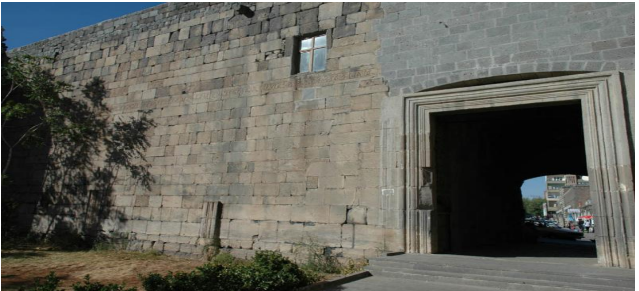
Foto 4. Diyarbakır şehrinin güneyine açılan kapısı Mardin Kapı