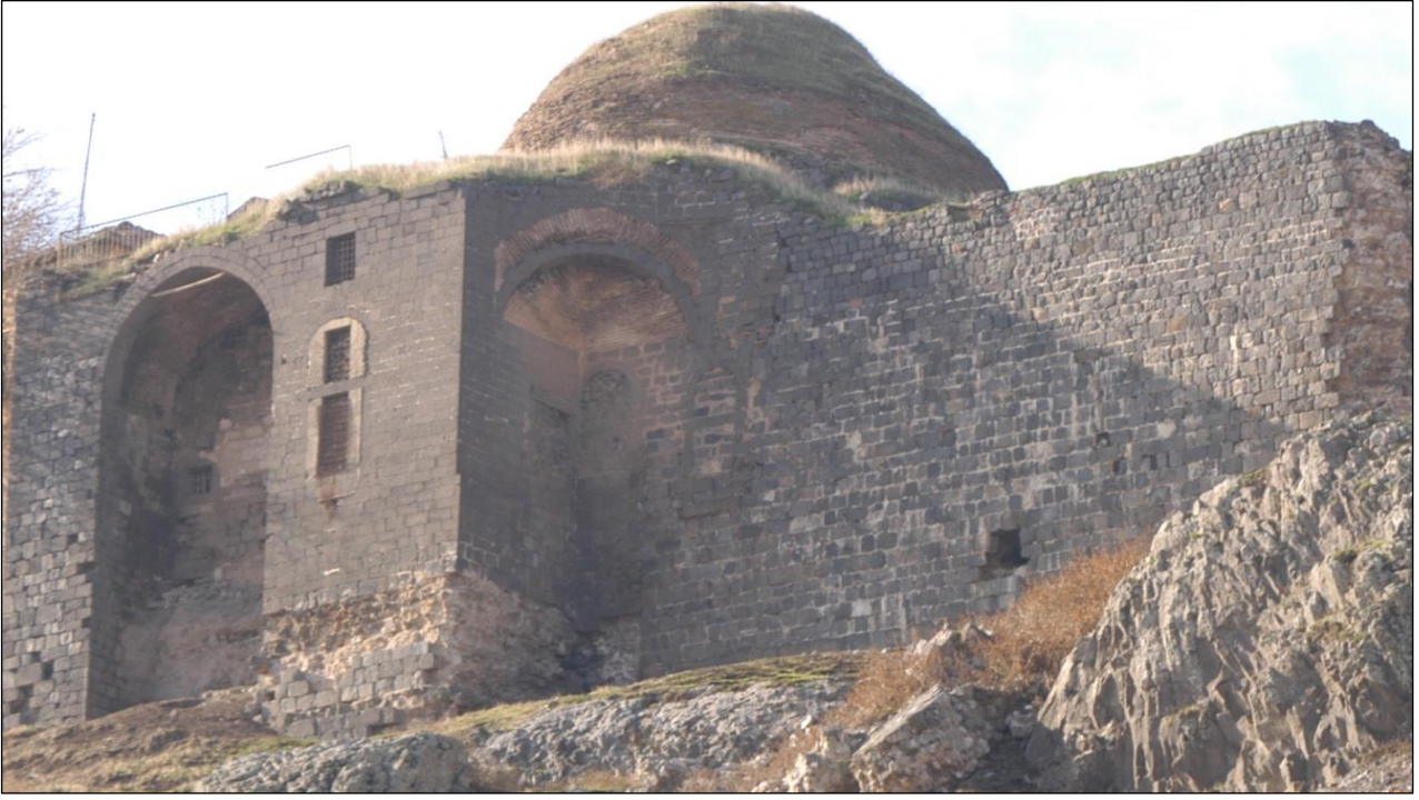
Foto 6. Diyarbakır şehrinin doğusuna açılan kapısı Yeni Kapı