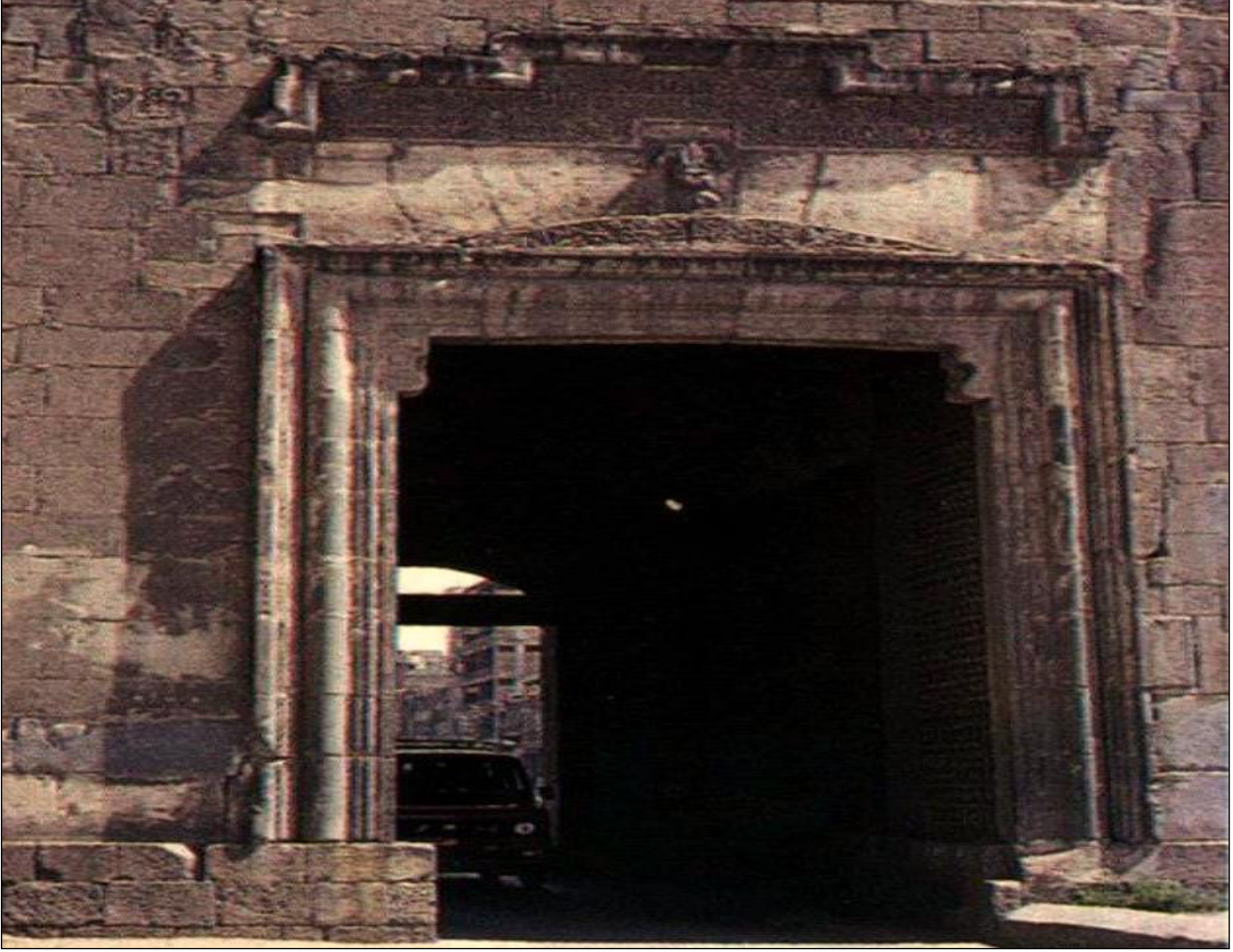
Foto 5. Diyarbakır şehrinin batıya açılan kapısı Urfa Kapı

Surların batısında bulunan Urfa Kapısı (Rum Kapısı) üç girişli olup, V.yüzyılda yapıldığı sanılmaktadır. Surların doğusundaki Yeni Kapı (Dicle Kapısı) 1240-1241 tarihlerinde Bizans döneminde yapılmış, basık kemerli tek girişli bir kapıdır.