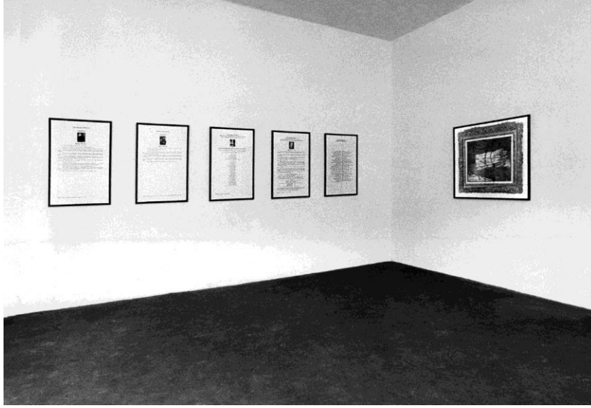
Görsel 1. Hans Haacke, "Manet-PROJEKT'74", 1974, Cam Altında Siyah Çerçevelerde On Adet Pano, Manet'in "Kuşkonmaz Demet" (1880) Çalışmasının Tek Renkli Fotoğraf Reprodüksiyonu, Fotoğraf: Rolf Lillig, Her Bir Pano 80 × 52 cm, Manet Üretimi 83 × 93 cm, Ludwig Müzesi, Köln.

Çalışmalarında kurumları hem mekân hem de konu olarak kullanan sanatçının bir diğer bilinen çalışması ise, Solomon R. Guggenheim Müzesi'nde 1974 yılında gerçekleştirmiş olduğu "Solomon R. Guggenheim Mütevelli Heyeti" isimli kişisel sergi önerisidir (Görsel 2) (Hans Haacke, tarih yok). Bu sergide, müzenin kurumsal sponsorlarının ve mütevelli heyetinin bir indeksinin müze duvarlarında sergilenmesi planlanmıştır ancak sergi açılıştan altı hafta önce iptal edilmiş ve sergi küratörü Edward Fry kovulmuştur. Haacke'nin çalışmaları bugün pek çok sanat kurumunun hem koleksiyonunda yer almaktadır hem de galerilerinde sergilenmektedir. Bunlardan bazıları; Londra'da Tate Galeri, New York Modern Sanat Müzesi, Şikago Sanat Enstitüsü'dür. Kurumsal eleştirinin kurumsallaşmaya doğru yol almış olduğunun net göstergesi de kurumların sanatçıların eleştirel pratiklerini koleksiyonlarına dahil etmiş olmalarıdır.