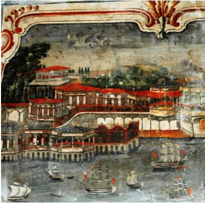
Figür 1. Hacı Öbek Evi/Kayseri (Y. Özbek'ten)

Bu çıkarımlar sonucunda, Safranbolu'nun ve İstanbul'un bütünlük oluşturmada baş oda levhasında birlikte resmedildiğini söylemek mümkündür.