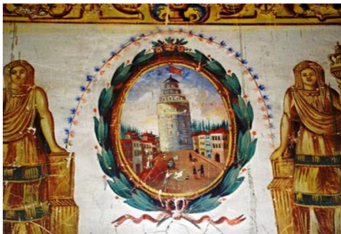
Figür 2. Mustafa Savaş Evi/ Ürgüp(Y. Özbek'ten)